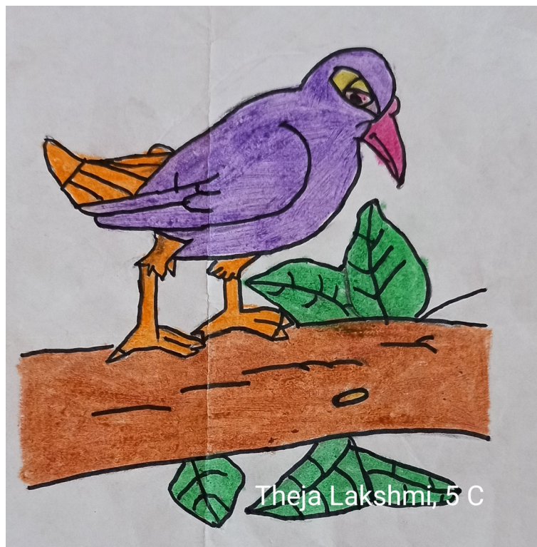
Theja Lakshmi, 5 C