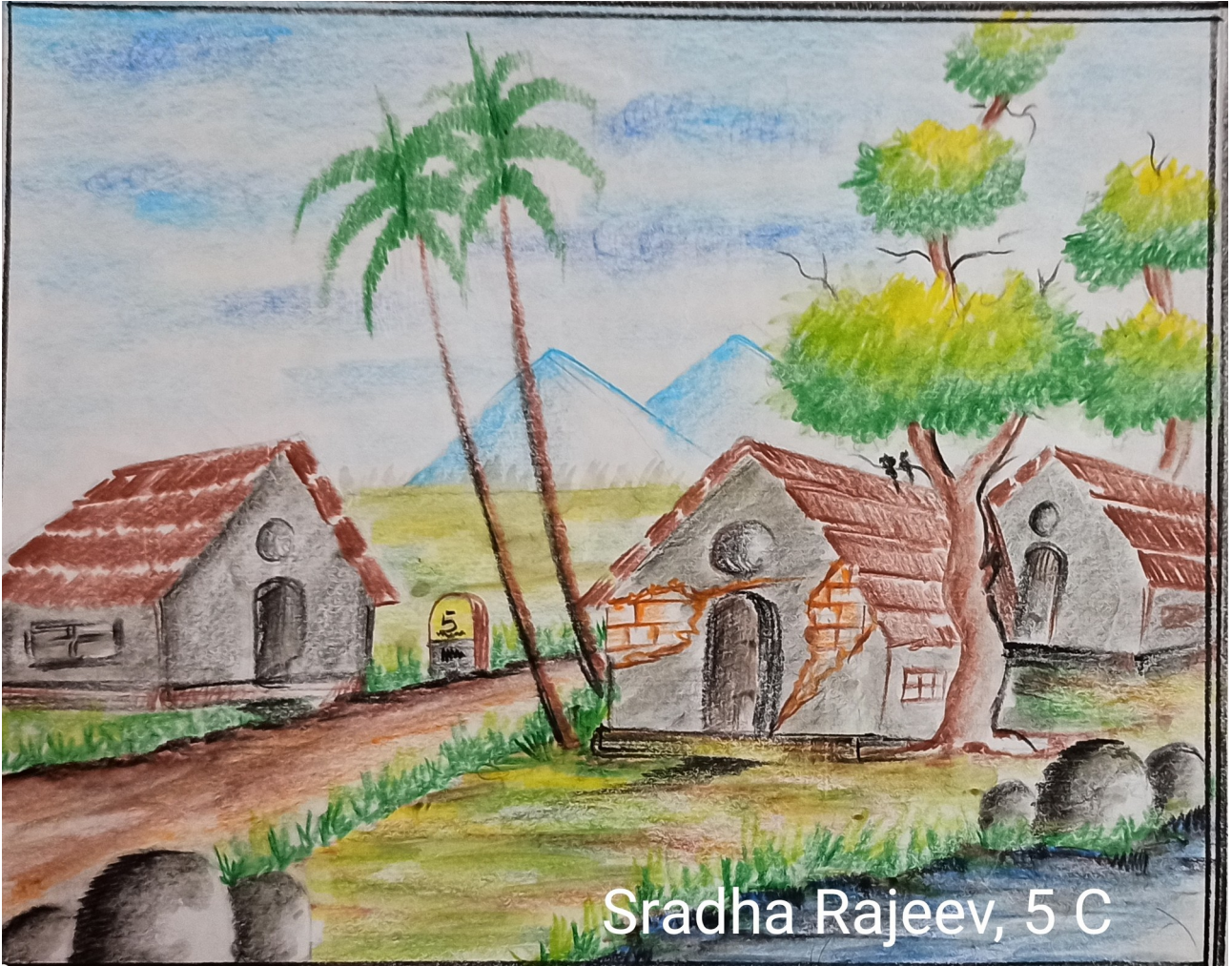
Sradha Rajeev, 5 C