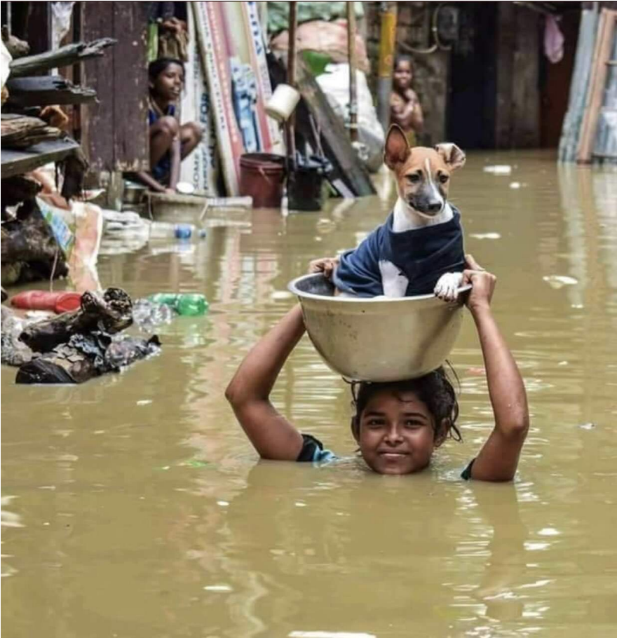
- ഉത്തര മേനോൻ 9H