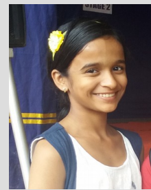
ഭവീക . എ . ആർ IX A

ചതുരംഗം കളിച്ചുതുടങ്ങി കാലാളിനെ വെട്ടി കുതിരയെ വെട്ടി കുത്തിയും മലർത്തിയും ചതുരംഗങ്ങളും ചോരക്കളമായി ചോരപ്പുഴയൊഴുകുമ്പോൾ അലർച്ചയ്ക്കും നിലവിളികൾക്കുമിടയിൽ നിർത്താതെയുള്ള കൊലച്ചിരി കറുത്ത ആകാശം കറുത്ത ഭൂമി വെണ്മയെ കാണാതെ അലയുമ്പോഴും കളി തുടരുകയാണ് അപ്പോഴെവിടെയോ ഉണങ്ങിക്കരിഞ്ഞ മരക്കൊമ്പിൽനിന്നും ഒരു വെള്ളരിപ്രാവ് എങ്ങോ പറന്നുപോയി.