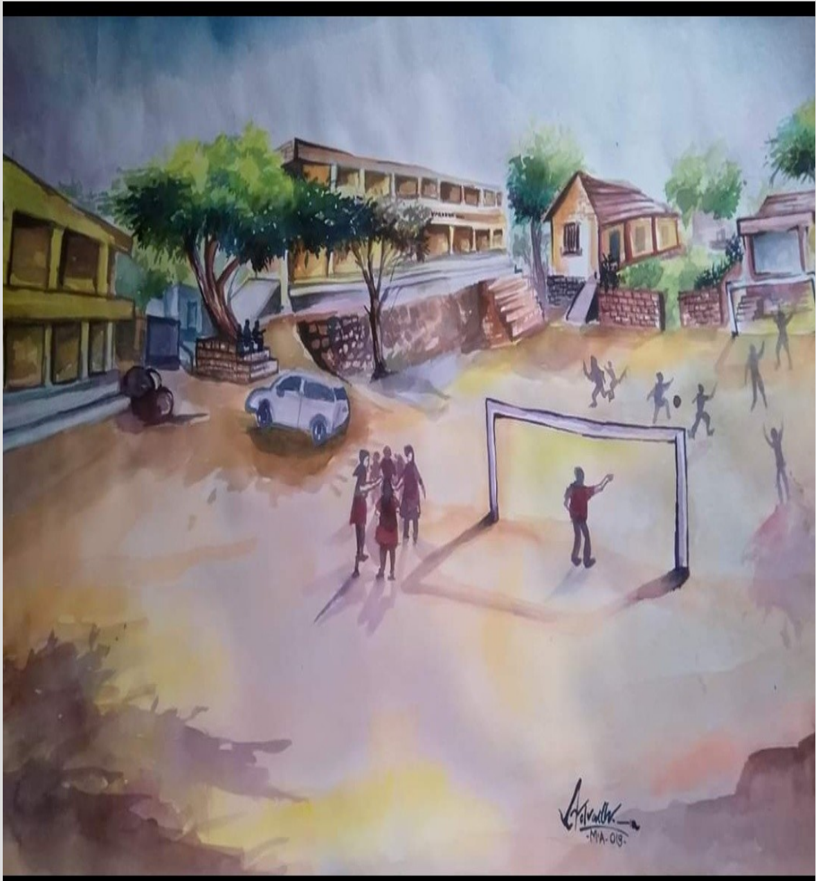
വര : അദ്വൈത് എം എ (പൂർവ്വ വിദ്യാർത്ഥി)