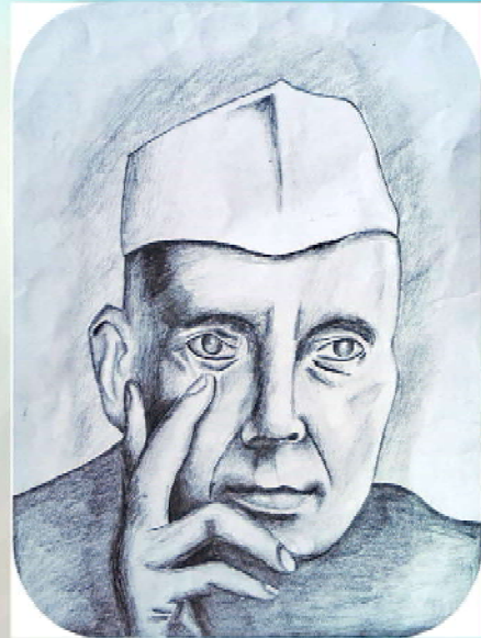
By Devanand M.D, 8 B