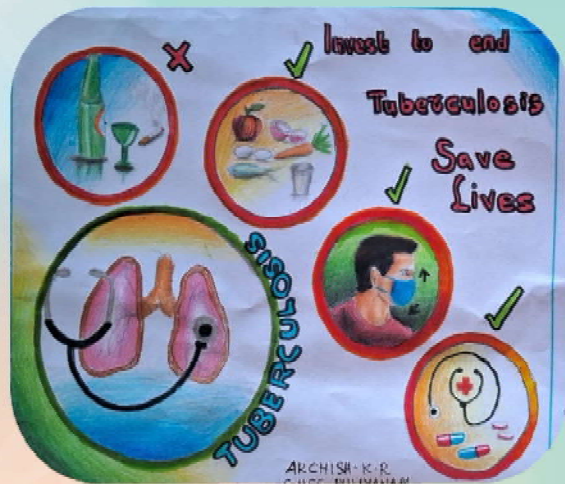
By Archish K.R, 8 B