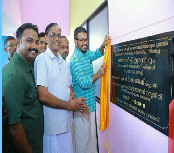
സ്റ്റാർട്ട് റൂം ഉദ്ഘാടനം