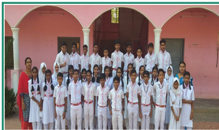
Junior Red Cross