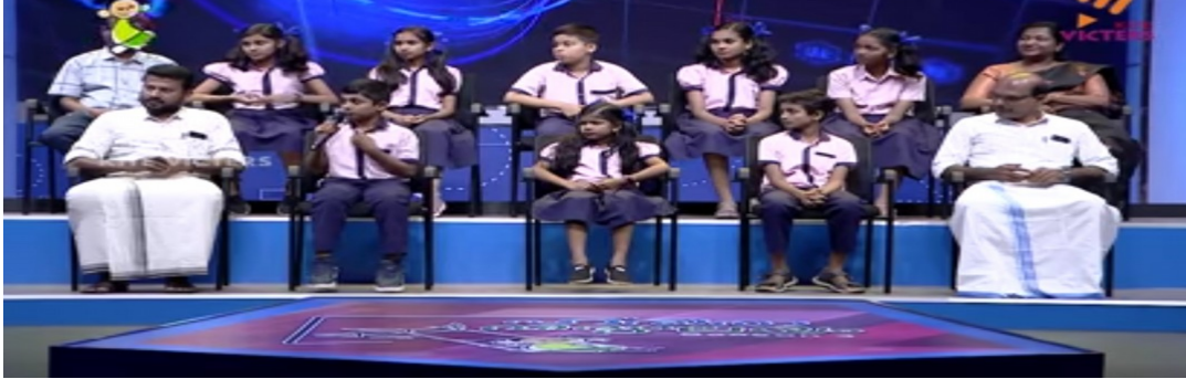
KITE VICTERS സംഘടിപ്പിക്കുന്ന ഹരിത വിദ്യാലയം റിയാലിറ്റി ഷോ സീസൺ 3 - ഇൽ നൂറിൽ 94 മാർക്കോടെ പുതിയകും സ്കൂൾ മുന്നോട്ട്