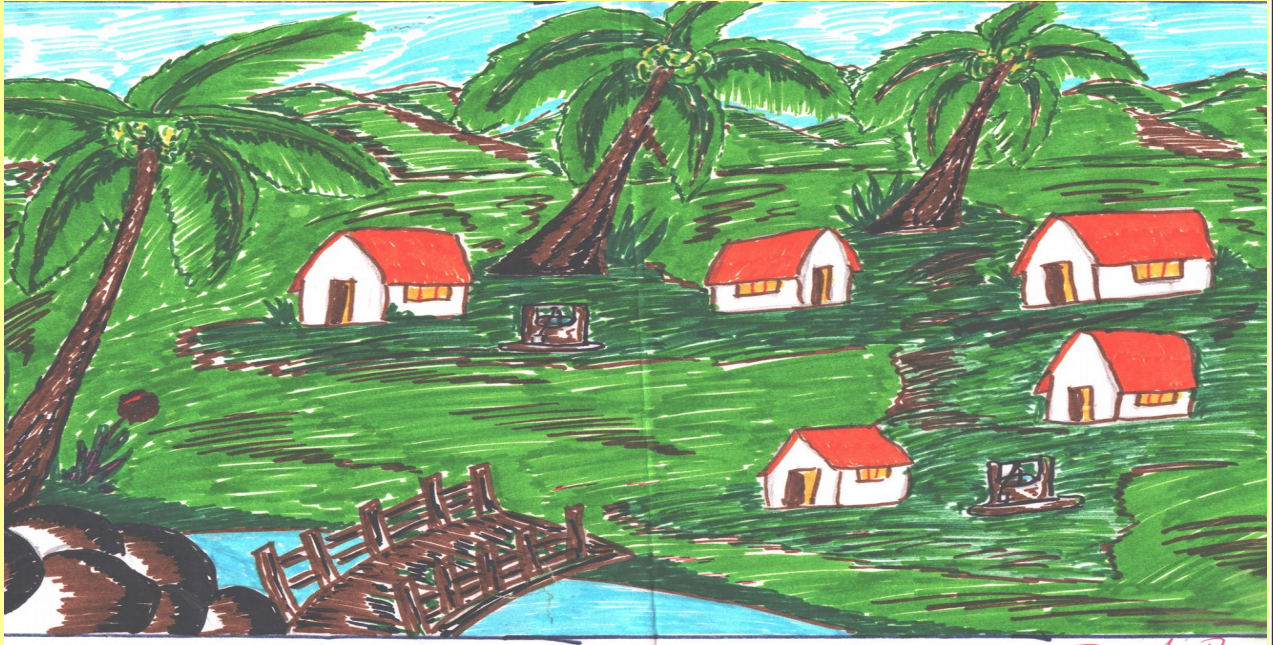
Prajeesh IX A