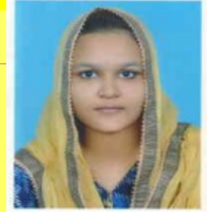
ആസീയ എച്ച് STD : IX B LITTLE KITES