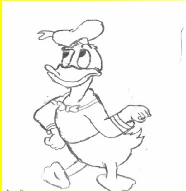
ആദിത്യൻ STD : 8B