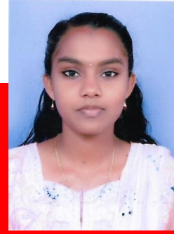
GOURI S STD: X B

ജീവൻ നല്ലിയാരമ്മ എന്റെ വീട്ടിലെ ഗൃഹനാഥയമ്മ സ്നേഹത്തിന് പുഴയാരമ്മ എൻ ജീവന്റെ ജീവനാം അമ്മ എന്നുമെൻ തുണയായി നില്ക്കുന്നമ്മ