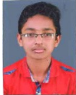
AGIL STD : IX F