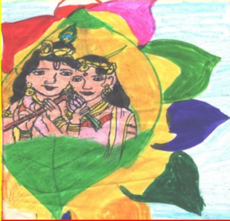
ശ്രീ ലക്ഷ്മി 8 A