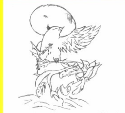
അനന്ദ 8 B