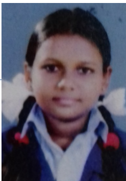
Bive Maria Wilson X D

I stay still At the window side. It was the rain! It was the thunder!