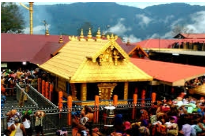
16 അനുഷ്ടാന കലാരൂപം പ്രസിദ്ധമാണ്.