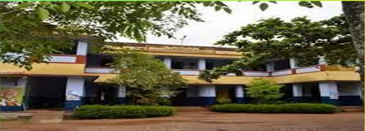
ലിറ്റിൽ കൈറ്റ്സ് 2018-19

എസ് വി ജി വി എച്ച് എച്ച് എസ് കിടങ്ങന്തൂർ