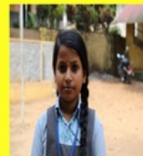
SREE BHADRA CLASS: VI A