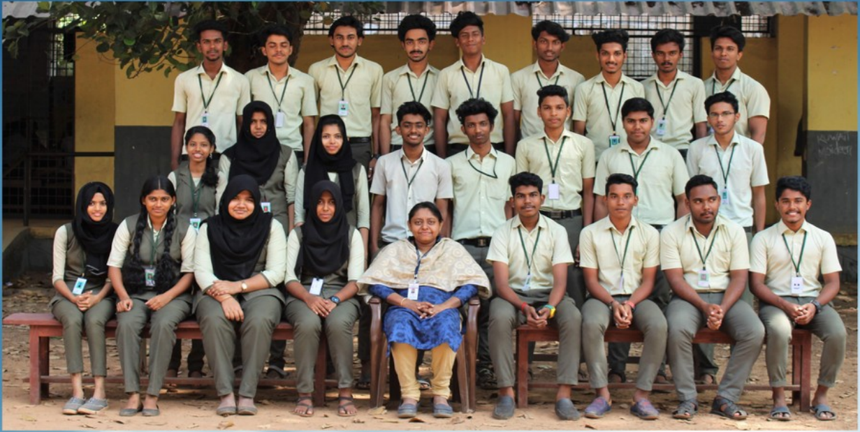
CSIT II YEAR