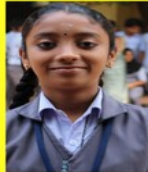
DEVU V R CLASS: VIII B