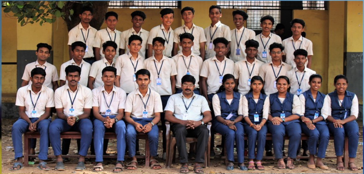
DBDO 1 YEAR