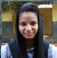
മജിന X B

പാടത്തിൻ കര നീളെ നീല നിറമായി കാടിനീടയിലെ സൗന്ദര്യമായി ഒഴികിടുന്നു നാടിന്റെ രക്ഷകായാലങ്ങളോളം അങ്ങനെ.. പുഴയുടെ കളിരും മനസ്സുമായി ചേർന്നലിയിക്കുന്നു പുലരി പ്രകൃതിയെ ഇണക്കിയതുപോൽ ചേർക്കാൻകാത്ത് നിൽക്കുന്നി നദി... മണ്ണിൻ മണമായി മണ്ണിനിണയായി മായാതെ നിൽക്കുന്നി മായാനദി..... കവിതയായി ഒഴുകുന്നി കാലത്തിന് ഒരു കാലൊച്ചയായി പാട്ടുപോലുണർന്ന് കാലത്തിനൊപ്പമായി ഒഴുകുന്നി നദി. കാട്ടാനകളും കാട്ടുമൃഗങ്ങളും ഒരുമിച്ചൊരിടം ഇവിടം ദാഹത്തിനൊരു കണ്ണീർ ജലം മാത്രമാകാൻ കഴിയാത്തൊരിടം നദി മിഴിയിലെ മൊഴിയും കലനൊഴുകിയ പുഴയിൽ തോണിയോടു കൂടി ഒഴുകുന്ന കാട്ടുമരങ്ങളും കാട്ടുരവികളും ചേർന്ന് പ്രകൃതിതൻ മനോഹരത്തെ പുഴയിലൂടെ ഒഴുകുന്നു. പ്രകൃതിയുടെ ദിക്കിലോ മൂലകളിലൂടെ ഒഴുകുന്ന പുഴ തന്റെ മനോഹാരിതയെ ദൈവം നമുക്ക് തന്ന സ്വത്തിലേർപ്പെടുന്നു പുഴയുടെ തീരവും മനോഹരമാക്കുന്ന ചില്ലുകളനക്കുന്ന കാറ്റാൽ പുഴ കളിർ ഏറ്റുവാങ്ങുന്നു മനസ്സിലായി ഇളമ്പുന്ന സ്നേഹത്തിന്റെ കാറ്റായി കാവലായ് എത്തുന്ന നദി ഒരോർമയിൽ നീങ്ങിടുന്നു അതൊഴുകാനായി ഇടം തേടിമായാനദിക്കായുള്ള കാത്തിരിപ്പ് കാലങ്ങളോളം ഇനിയീവിടം മായാതെ നിൽക്കുന്ന ഈ നദിമായാനദി. എനും തെളിയിക്കുന്നു ഈ ഒഴുക്കിനെ വേദനയാക്കിലെന്ന്.