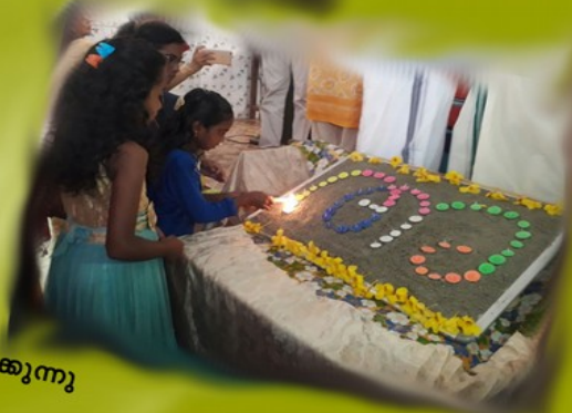
കുട്ടികൾ അക്ഷരദീപം തെളിയിക്കുന്നു