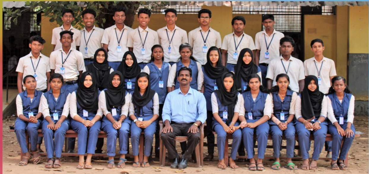
SA 1 YEAR