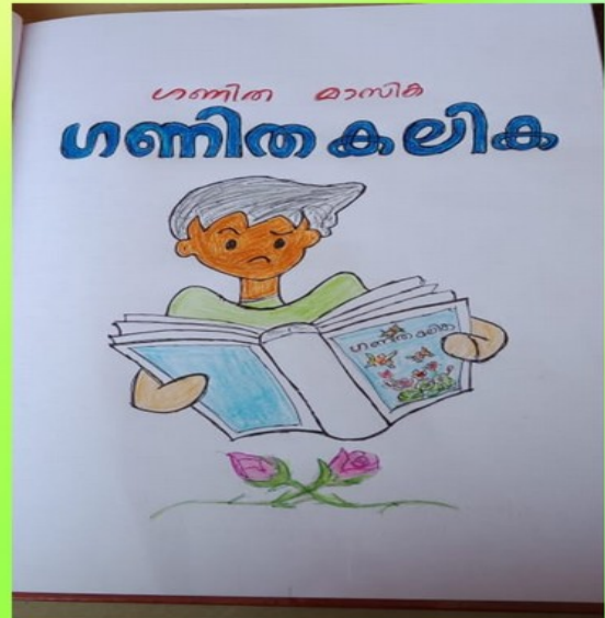
ഉപജില്ലാ തലത്തിൽ ഒന്നാം സ്ഥാനവും ജില്ലാ തലത്തിൽ A ഗ്രേഡ് നേടി