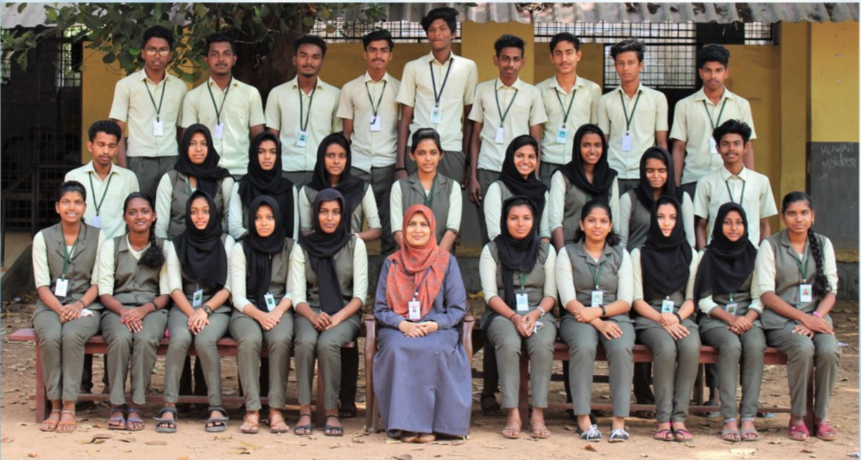
MFS II YEAR