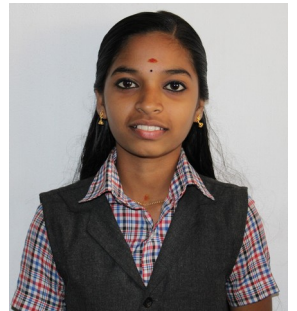
ദേവപ്രഭ. കെ.എസ് 8B

മഹാ പ്രളയത്തിൽ ഉടുവസ്ത്രം പോലും നഷ്ടപ്പെട്ട അനേകായിരങ്ങളുടെ കണ്ണീരും വേദനയും തിരിച്ചറിഞ്ഞ് വീണ്ടും അവരെ ജീവിതത്തിന്റെ നേർക്കാഴ്ചകളിലേക്ക് തിരിച്ചുകൊണ്ടുവരാൻ നമുക്ക് ഒത്തുചേർന്ന് ആത്മവീര്യം പകർന്നുനൽകാം. ഒപ്പം ഒരു കൈത്താങ്ങും.