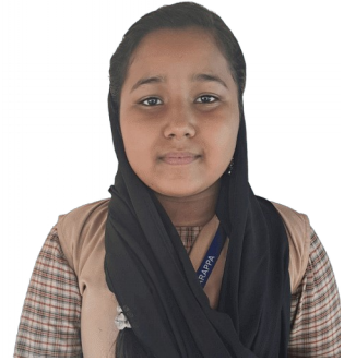
ഫാത്തിമത്ത് നിൽവ 6C