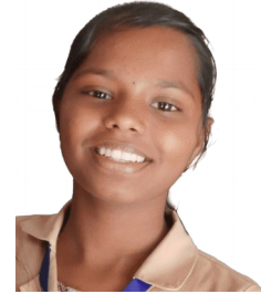
അൽഫോൻസ എയ്ഞ്ചൽ 8C

നിഴൽ നീണ്ട യാമങ്ങളിൽ എവിടെ നിന്നോ പൊട്ടിപ്പറപ്പെട്ട പ്രകാശത്തിന്റെ നിഴൽ കൊണ്ട് നീണ്ടു വിസ്തൃതമായി കിടക്കുന്ന ഒരു കൊടും കാട് ,നീറയെ സസ്യ ജന്തുജാലങ്ങൾ ഇണങ്ങിയും പിണങ്ങിയും ജീവിച്ച പ്രകൃതിയെന്ന സ്വർഗ്ഗത്തിന്റെ ഒരു ചെറിയ ഭാഗം. മുത്തശ്ശി മാവിന്റെ മരത്തിലെല്ലാം പാടി പറക്കുന്ന കിളികൾ, മാനവം രചിക്കുന്ന അണ്ണാൻ എല്ലാം സ്വസ്ഥമായി കഴിഞ്ഞിരുന്ന കാലത്താണ് മൃഗങ്ങളായ മനുഷ്യരുടെ കടന്നു കയറ്റം. വിസ്തൃതമായ ആ സ്വർഗ്ഗത്തിലേക്ക് കട്ടറൂമ്പുകൾ എന്നപോലെ കുഞ്ഞനണ്ണനും കൂട്ടുകാരും മാനവം കടിച്ചും കൂട്ടുകാരോടൊപ്പം കളിച്ചുകൊണ്ട് നിൽക്കുമ്പോഴാണ് ആ കഠിനമായ ശബ്ദം കേട്ട് കൂട്ടുകാരെല്ലാം ഇരുദിക്കുകളിലോടിയകുന്നത് .അണ്ണാൻ മാത്രമൊറ്റക്കായി .മനുഷ്യരുടെ കടന്നുകയറ്റം അവൻ സഹിക്കാവുന്നതിനപ്പുറമായിരുന്നു .മരങ്ങൾ വെട്ടിമാറ്റി പുഴനികത്തി. ആവാസ വ്യവസ്ഥകൾ നഷ്ടപ്പെട്ടു .അവൻ അവന്റെ പ്രിയ കാമുകിയെയും അമ്മയെയും നഷ്ടമായി .മൃഗങ്ങളായ മനുഷ്യർ അവന്റെ പിറന്ന നാടിനെ ചുട്ടെരിച്ചു .ഈ കഠിനമായ ദൃശ്യത്തിന് സാക്ഷിയായി .ആ തരിശു ഭൂമിയിൽ അവൻ മാത്രം ബാക്കിയായി .നാളുകൾക്ക് ശേഷം അവൻ മണ്ണോടലിഞ്ഞു .