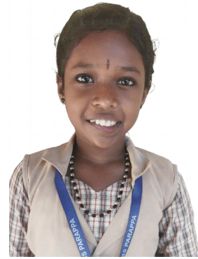
തപസ്യ മോൾ 5B