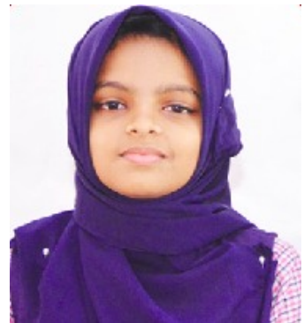
സന എ ജില്ലാഗണിതശാസ്ത്രമേള നമ്പർചാർട്ട് മൂന്നാംസ്ഥാനം