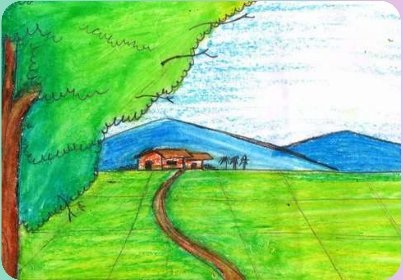
വര - ഗായത്രി ജി.പി IX A