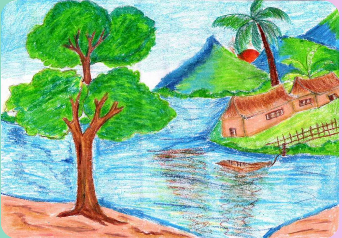
വര - ശിവലക്ഷ്മി.കെ.എസ് IX B