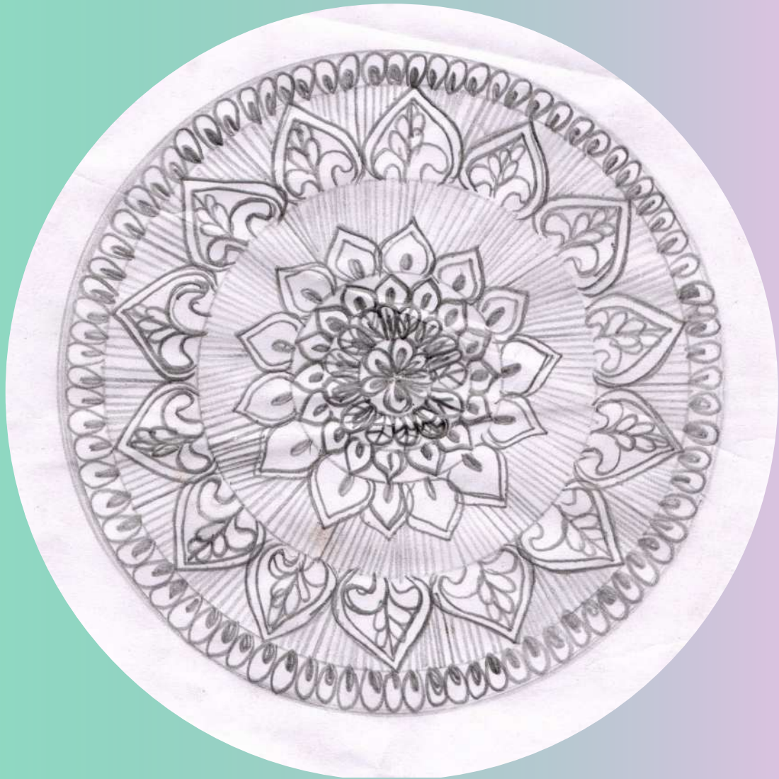
വര - ലിയ.എസ്.ഘ്രാജ്ജിൻ VIII C