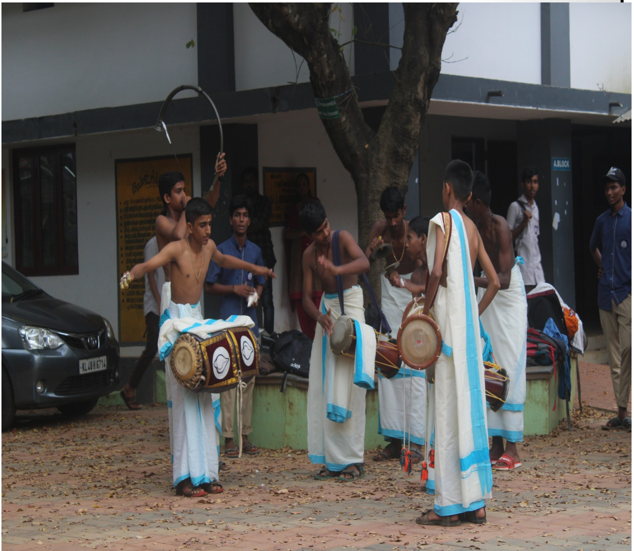
സ്കൂളിന്റെ നേതൃത്വത്തിൽ നടത്തുന്ന പഞ്ചവാദ്യ പരിശീലനം.