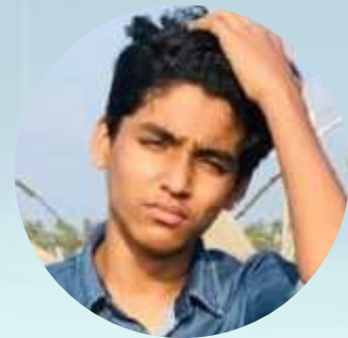
എറണാകുളം അട്റാൻ സി 10 B

Are you awake he said he had killed a person and he is guilty which it has driven him crazy. I tried to inquire more but he didn't bother my question every time but on one question he melted and like a child it was about what made him to do such an act. Replied he was an entrepreneur in the west coast he used to be very successful but on one day he found out that his Fran who was a partner had betrayed him he went really mad and crazy he used to do drug back in the day. He went on acting later he didn't know that nothing in front of his partner but on one day he got high on drugs and went into his friends place and smashed his both hands and the skinned to him alive he was dead on the next day he was awake in his friends place he didn't know who ended up there but he was petrified to see his friends lifeless friends body laying there. He remember what happened but he was very afraid to surrender because he could lose all of his status and value so he did the unthinkable he chopped his friends body into tiny pieces and burn lifted after some day he was having trouble to sleep because of the incident he was shock with insomnia he even tried to suicide but didn't held the courage. When i went out of my office to call the authorities he sensed it and ran away I still remember that day it was a vivid drawn to me.