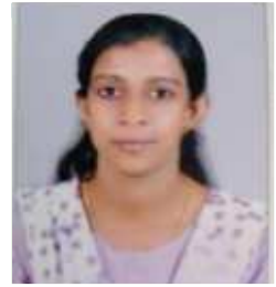
NISHA HSA ENGLISH

May 'Kala layam' go as bright as a morning star. I would like to congratulate the students and teachers behind it. Give in your best shots and keep your spirits high. Best wishes.