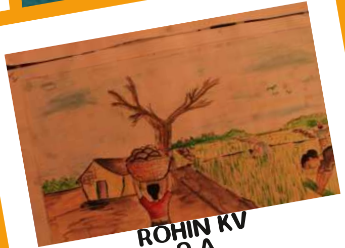
ROHIN KV 9 A