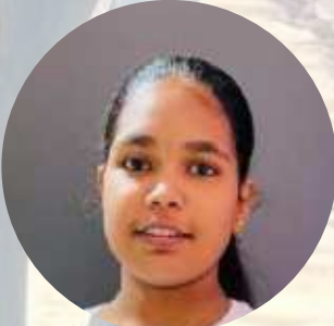
ദയ 9 B