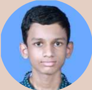
ആദിത്യ ഇ പി 9 B

ആദ്യ ദിവസങ്ങളിൽ ഒന്നും അവൻ മാറ്റം വന്നിരുന്നില്ല പിന്നെ ദിവസങ്ങൾ കഴിയുമ്പോൾ അവന്റെ അക്രമ സ്വഭാവം എല്ലാം കുറഞ്ഞുവന്നു. പിന്നെ ഇല്ലാതാവുകയും ചെയ്തു അവിടെ അവൻ ലഭിച്ചിരുന്നത് നല്ല ചികിത്സയായിരുന്നു തമാശകൾ പറഞ്ഞും കേട്ടും നല്ല കാര്യങ്ങൾ പഠിച്ചു അവന്റെ മനസ്സിൽ ശുദ്ധമായി വന്നു അവൻ മറ്റുള്ളവരോട് പെരുമാറുന്ന രീതിയും സ്നേഹിക്കാനും പഠിച്ചു. ആ സ്ഥലത്ത് നിന്ന് വിട്ടു പിരിയുമ്പോൾ അവൻ മറ്റൊരു മനുഷ്യനായി മാറി ആ മാന്ത്രികം അവന്റെ ജീവിതത്തിലെ രണ്ടാം ജന്മം ആയിരുന്നു. അവസാന ദിവസം അവന്റെ മാതാപിതാക്കൾ അവനെ തിരികെ വീട്ടിലേക്ക് കൊണ്ടുപോകാൻ വന്നു അവൻ അന്ന് നന്നാക്കിയ ആ സ്ഥലത്തെയും അന്തരീക്ഷത്തെയും സുഹൃത്തുക്കളെയും ഡോക്ടറേയും വിട്ടു പിരിയാൻ അവനു മടിയുണ്ടായിരുന്നു കുറെ നാളുകൾക്ക് ശേഷം അവൻ സ്നേഹത്തോടെ അവനെ മാതാപിതാക്കളെയും വിളിച്ചു അച്ഛനെയെ ഇത് കേട്ടു മാതാപിതാക്കൾക്ക് സന്തോഷം കാരണം പൊട്ടിക്കരഞ്ഞു അവനെ പഴയതിൽ നിന്ന് നല്ല മാറ്റം വന്നു ഇനി അവൻ ഒരു ജോലിയുടെ കുറവ് മാത്രമേ ഉള്ളൂ. ജോലിക്ക് വേണ്ടി അവൻ മൂന്നുമാസത്തോളം കഷ്ടപ്പെട്ട് പ്രയത്നിക്കാൻ തുടങ്ങി പെട്ടെന്ന് തന്നെ അവൻ ഒരു വലിയ കമ്പനിയിൽ ഒരു ജോലി കിട്ടി കുറച്ചു കഴിഞ്ഞപ്പോൾ അവൻ വിവാഹം കഴിച്ചു ജീവിതം സുരക്ഷിതമാക്കി അവന്റെ തിരിച്ചുവരവ് അവന്റെ ജീവിതത്തിലെ രണ്ടാം ജന്മം ആയിരുന്നു പിന്നീട് സുഖമായി സന്തോഷത്തോടെയും ജീവിച്ചു. ഈ കഥയിൽ മോശമായ അവസ്ഥയിൽ നിന്ന് വിജയൻ എന്ന കഥാപാത്രം ജീവിതത്തിലേക്ക് വീണ്ടും ജനിക്കുകയാണ് അയാളുടെ രണ്ടാം ജന്മം ഇതിൽ നിന്ന് നമുക്ക് കിട്ടുന്ന ഗുണപാഠം എന്തെന്ന് വെച്ചാൽ നമ്മുടെ ജീവിതത്തിൽ നമ്മൾ തോറ്റുപോയാൽ നമ്മൾ തിരിച്ചുവരവിന് പരിശ്രമിച്ചാൽ ജീവിതത്തിൽ വിജയം കൈവരിക്കാൻ നോക്കണം ആ വിജയം നമ്മുടെ ജീവിതത്തിലെ രണ്ടാം ജന്മമായി മാറ്റം