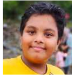
ARCHITHAN N 9 A