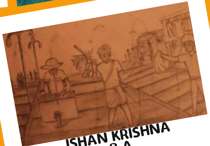
ISHAN KRISHNA 8 A