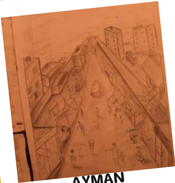
AYMAN 10 A