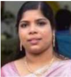
SABITHA HSA MALAYALAM

2023-24 അധ്യയന വർഷത്തിൽ ഗവ.ടെക്നിക്കൽ ഹൈസ്കൂൾ കോഴിക്കോട് അഭിമാനപൂർവ്വം കല ലയം എന്ന ഡിജിറ്റൽ മാഗസിൻ സമർപ്പിക്കുന്നു. മാറ്റുന്ന ലോകത്തിൽ സാങ്കേതിക വിദ്യക്ക് കൂടുതൽ പ്രാധാന്യമുണ്ടല്ലോ, അത് കയ്യെഴുതിനേക്കാൾ ഉപരിയായി കുട്ടികൾക്ക് താൽപര്യജനകവുമാണ്. വിദ്യാർത്ഥികളും രക്ഷിതാക്കളും പങ്കാളികളാകുന്ന ഈ മാഗസിൻ വിജയമായിത്തീരവാൻ ഏവരുടെയും സഹകരണം പ്രതീക്ഷിക്കുന്നു. ആശംസകളോടെ,