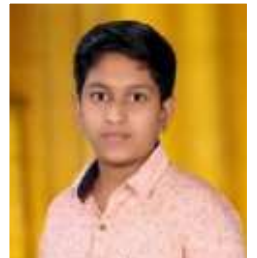
PARTHIV 9 A