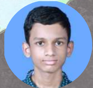
ആദിത്യ ഇ പി 9 B