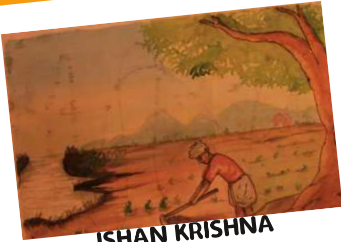
ISHAN KRISHNA 8 A