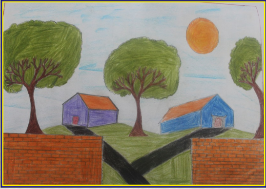
B ATHUL KRISHNA