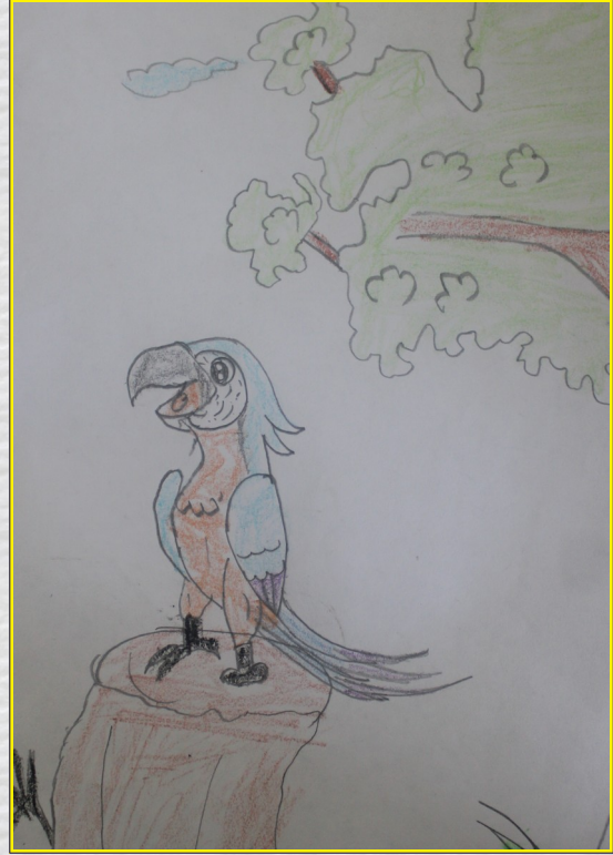
AKASH S K