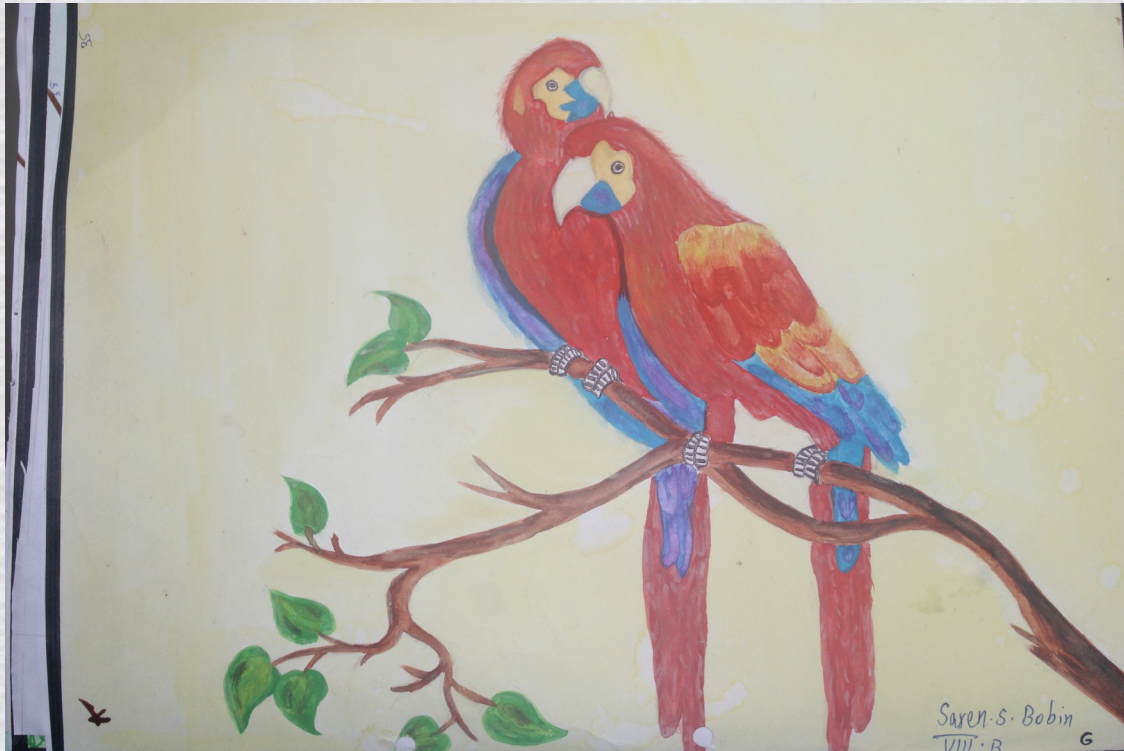
SAREN S BOBIN