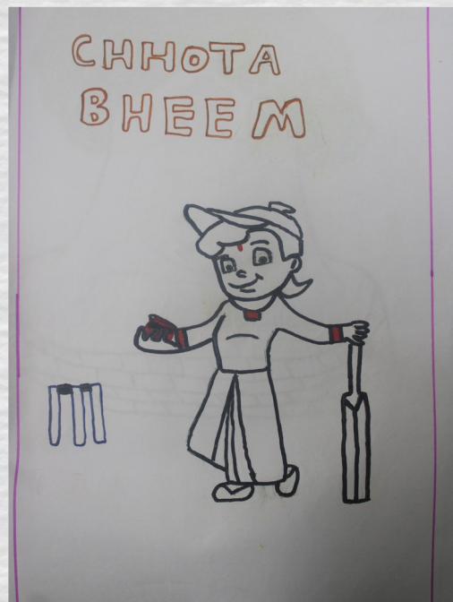
B ADHUL KRISHNA