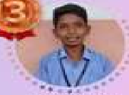
MARSHAL K V III place A grade