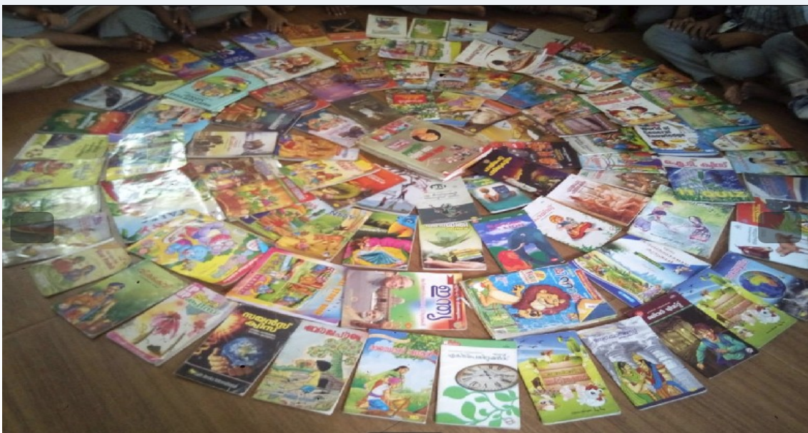
ജി. എച്ച്.എസ്. ബാര