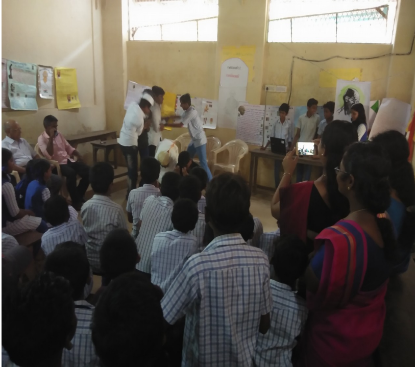
ഗാന്ധി ജയന്തി - ഗാന്ധി ദർശൻ ക്ലബ്ബ് കലാപരിപാടികൾ