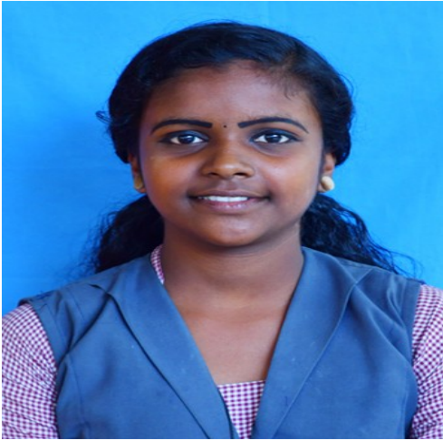
SHYINI S 9 B