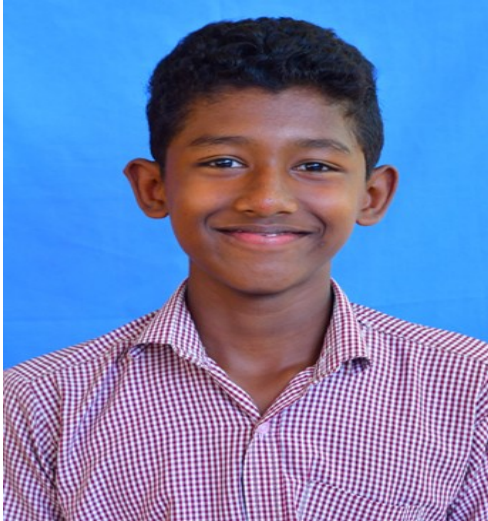
ASIF 9 A