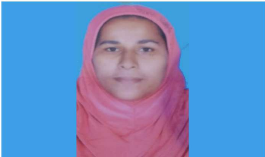
പി.ടി.എ വൈസ് പ്രസിഡണ്ട് - ആയിശ