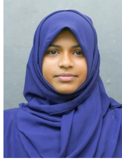
റിൻസിയ .പി.എം. VIII.C