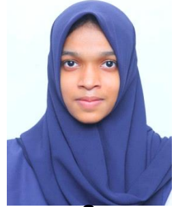
ഹഫീഫ 9 F