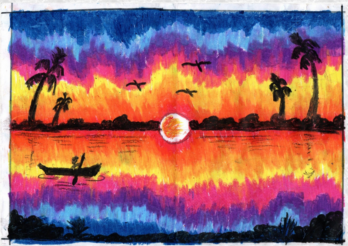
ആർദ്ര വി. എ. VB