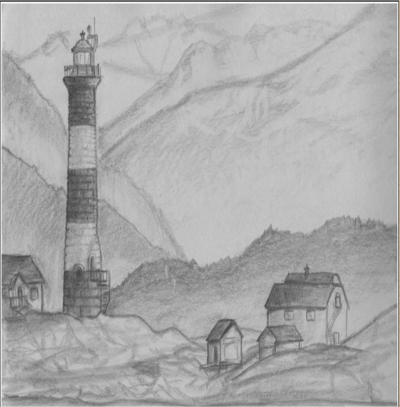
- ARUN BALU