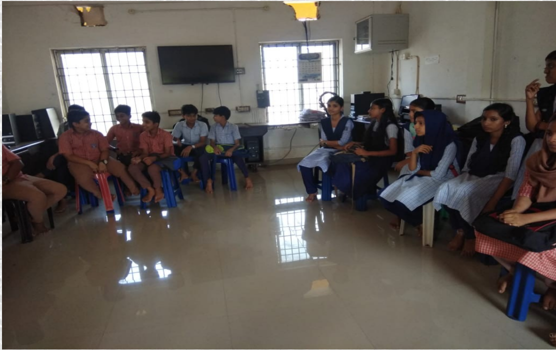
എസ് പി സി