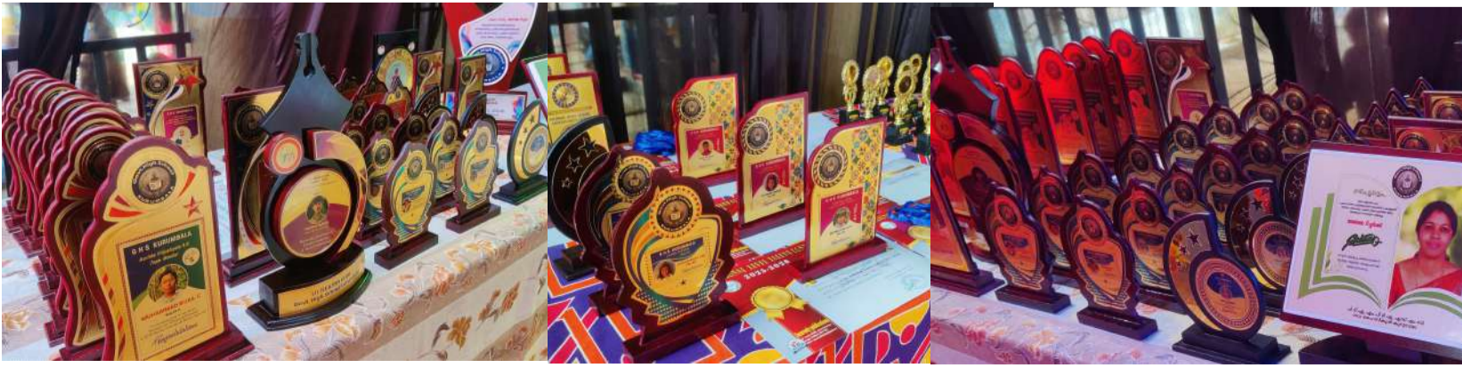
സ്കൂൾ വാർഷികാഘോഷ ചടങ്ങിൽ വിവിധ മേഖലകളിൽ പ്രതിഭ തെളിയിച്ച കുട്ടികൾക്ക് സമ്മാനിച്ച ഉപഹാരങ്ങൾ