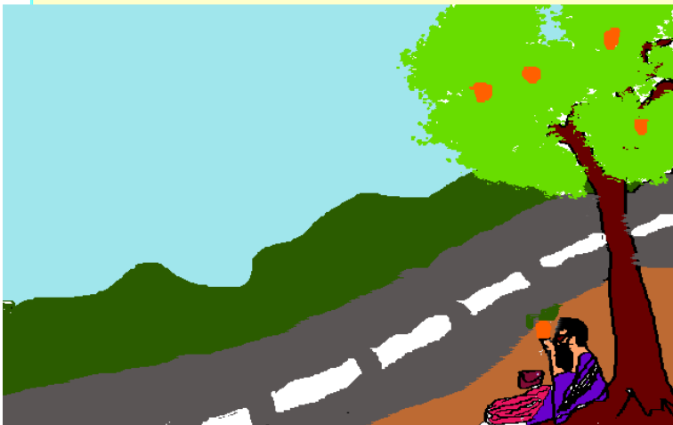
Binil Denny 9 b