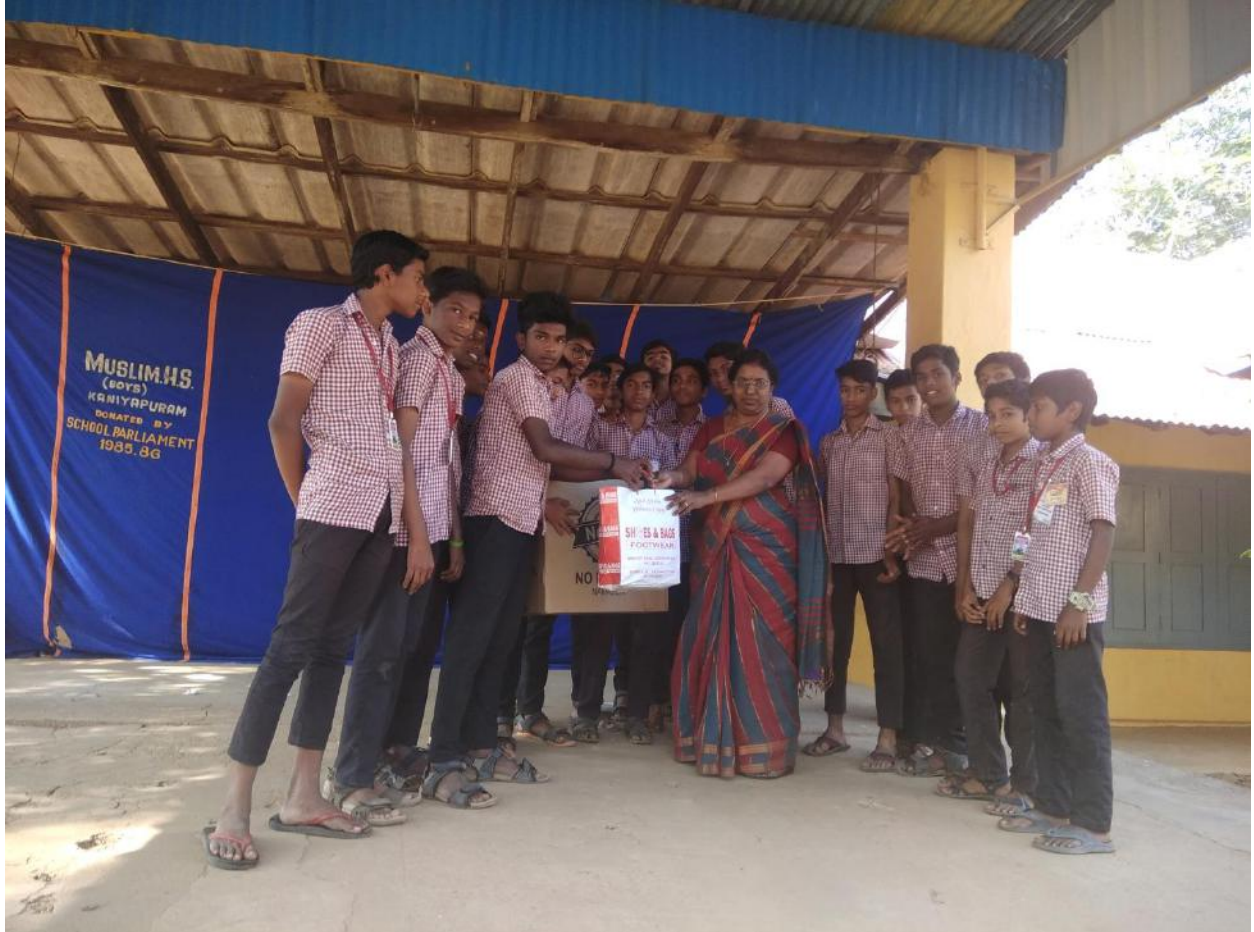
പ്രളയത്തോടനുബന്ധിച്ച് ലിറ്റിൽ കൈറ്റിലെ കുട്ടികൾ ശേഖരിച്ച് വസ്തുക്കൾ പ്രധാന അധ്യാപികയ്ക്ക് കൈമാറുന്നു.