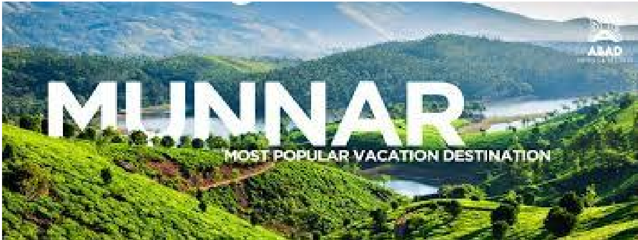
The most Tourist place in Idukki