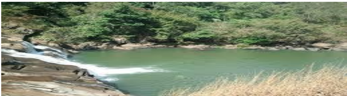
The beautiful in swimming place