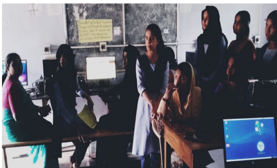
QR കോഡ് എങ്ങനെ? ക്ലാസ് ശ്രവിക്കുന്ന കുട്ടികളും, അമ്മമാരും