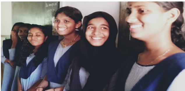
CLASS TOPPERS WITH MEDALS

ഹൈ ടെക് വിദ്യാഭ്യാസത്തിൽ കുട്ടികളെ സഹായിക്കുന്നതിന് ഐ ടി പഠനത്തിന്റെ പ്രാധാന്യം മനസ്സിലാക്കിയ അമ്മമാർ വീണ്ടും വരുമെന്ന് പറഞ്ഞാണ് പിരിഞ്ഞത് . വിജ്ഞാനവും, വിനോദവും, പഠനപുരോഗതിയും അറിഞ്ഞ PTA യോഗം അവിസ്മരണീയ അനുഭവമാണ് രക്ഷിതാക്കൾക്ക് സമ്മാനിച്ചത്.