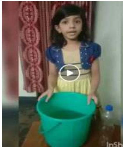
ചെയ്ത് നോക്കാം കണ്ടെത്താം

സയൻസ് ക്ലബ്ബുമായി ബന്ധപ്പെട്ട് പറന്ന പരീക്ഷണങ്ങൾ വളരെ അർത്ഥവത്തായി നടത്താനായത് രക്ഷിതാക്കളുടെ സഹകരണത്തിന് മറ്റൊരു ഉദാഹരണമായിരുന്നു. ചെയ്ത് നോക്കാം കണ്ടെത്താം പ്രവർത്തനങ്ങൾ കുട്ടികൾ മനോഹരമായി അവതരിപ്പിച്ചു. അനുഭവത്തിലൂടെ അറിവിന്റെ മേഖലയുടെ ആഴത്തിലേക്ക് കടന്നുപോകാൻ ഏറെ പ്രയോജനപ്പെടുന്നുവെന്നു സയൻസ് കോർണറുടേത്.