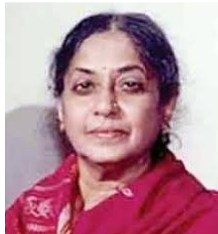
Mattakkara HSS Little Kites