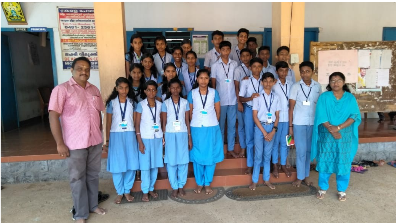
Mattakkara HSS Little Kites