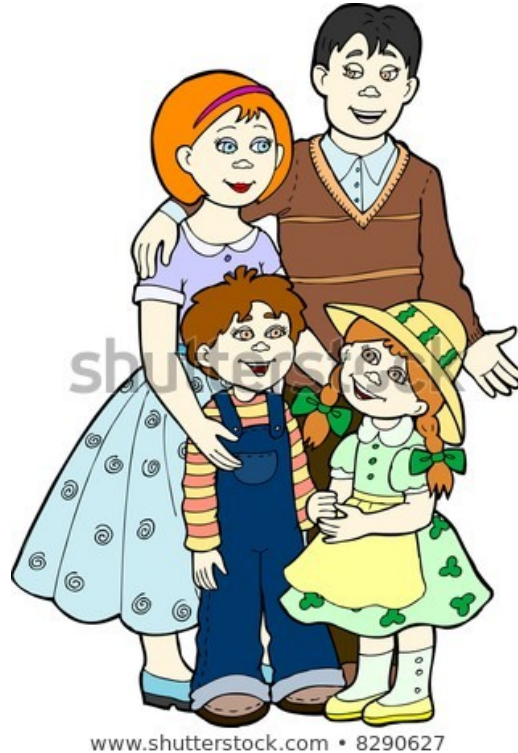
www.shutterstock.com • 8290627

പതിവുപോലെ ഞാൻ നേരത്തെ എഴുന്നേറ്റു . എൻറെ പ്രഭാതകർമ്മങ്ങൾ നടത്തിയശേഷം , പാടവരമ്പിലൂടെ നടക്കുകയായിരുന്നു . പല്ല് തേക്കാനും , കുളിക്കാനോ , എന്തിന് കുടിക്കാൻ പോലും വെള്ളമില്ല . അങ്ങനെ ആ കൊടുചുടത്ത് ഞാൻ ഇറങ്ങി തിരിച്ചു . വഴിയിൽ കുറെ സ്ത്രീകളെയും, കുട്ടികളെയും കണ്ടു, അവർ സമീപ ഗ്രാമത്തിലേക്ക് വെള്ളം തേടി പോകുന്നതാണ് . ആ പോക്ക് എവിടെ അവസാനിക്കും എന്ന്