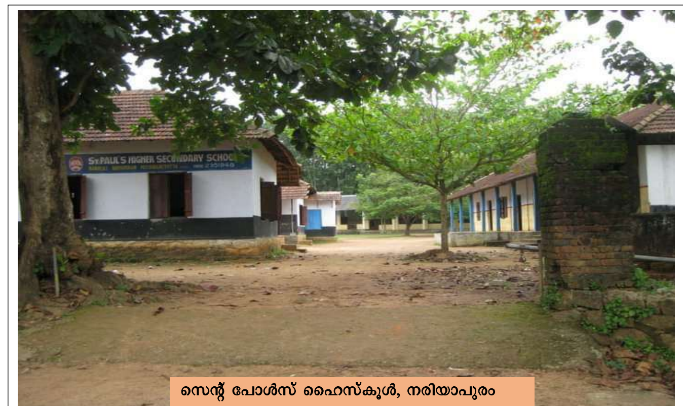
സെന്റ് പോൾസ് ഹൈസ്കൂൾ, നരിയാപുരം