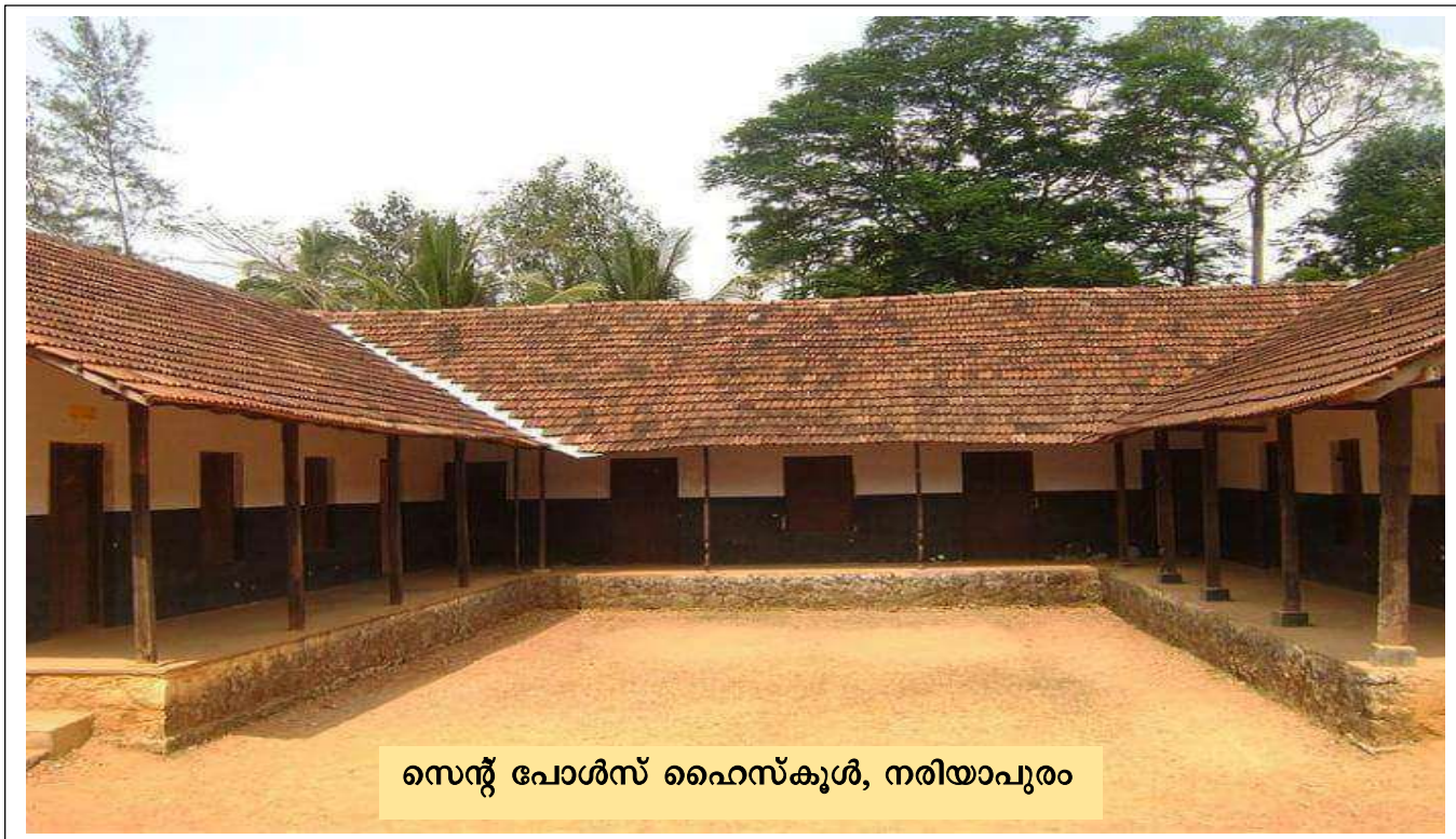
സെന്റ് പോൾസ് ഹൈസ്കൂൾ, നരിയാപുരം