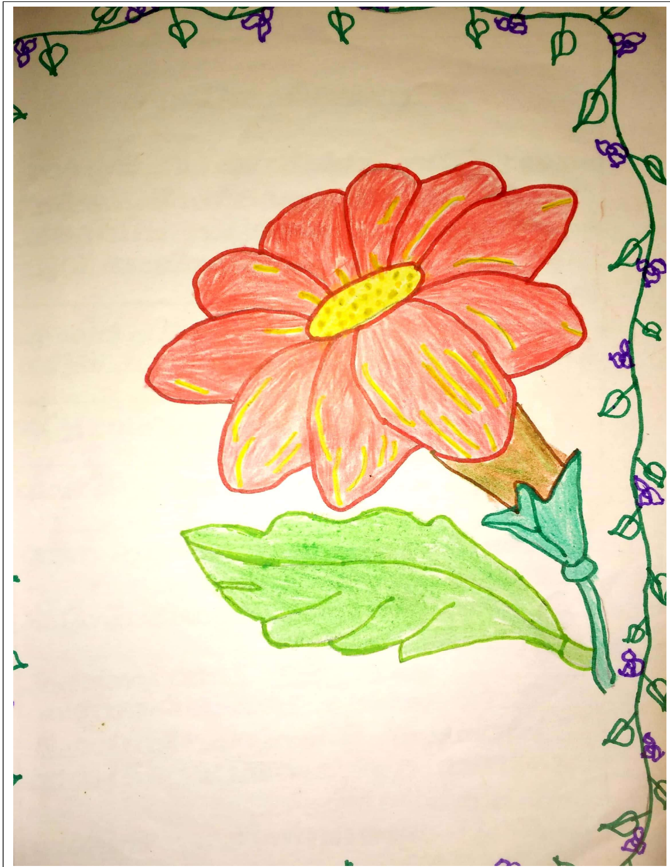
അർച്ചന എസ്. മുരളി