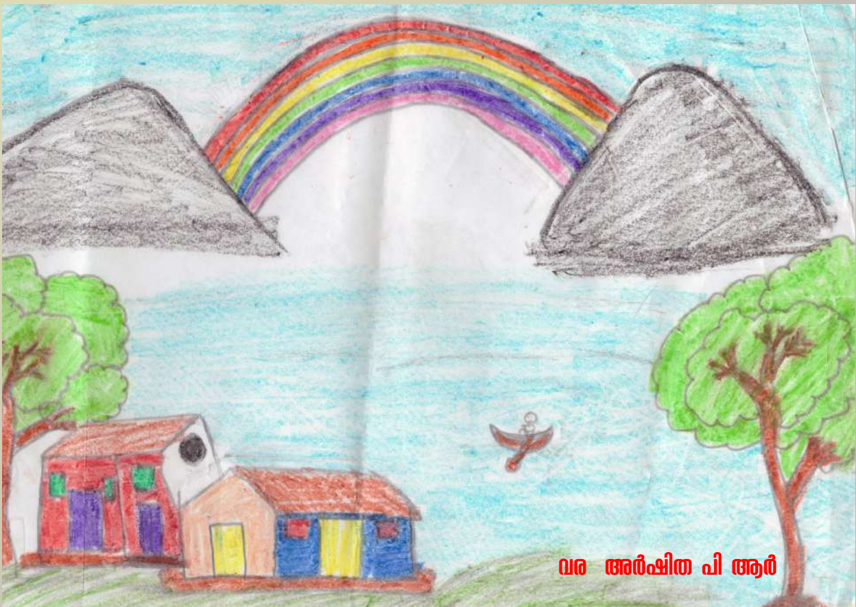
വര അർഷിത പി ആർ

പ്രകൃതി സൗന്ദര്യം നിറഞ്ഞു നിൽക്കുന്ന ഗ്രാമമാണ് ഓടപ്പള്ളം എന്ന ഗ്രാമം. പ്രകൃതിയുടെ വരദാനമായി കാടിനോട് ചേർന്നാണ് എന്റെ ഗ്രാമം സ്ഥിതിചെയ്യുന്നത്. ഇടതിങ്ങി വളർന്നു നിൽക്കുന്ന ചെടികൾ.. ഉഷ്ണതാലാടാൻ പാകത്തിന് ചാഞ്ചാടി കളിക്കുന്ന വള്ളിപ്പടർപ്പുകൾ.. പാട്ട് കണ്ണു കുത്തി കളിക്കുന്ന പക്ഷി മൃഗാദികൾ.. പുഞ്ചിരിച്ചു നിൽക്കുന്ന കാട്ടുപൂക്കൾ തേൻ നുകരാൻ എത്തുന്ന പുമ്പാറ്റകളും വണ്ടുകളും കളകളാരവം പെഴിക്കുന്ന കാട്ടുതവികൾ.. സൂര്യനെ തടഞ്ഞു നിൽക്കുന്ന വൻമരങ്ങൾ.. ഇവയെല്ലാമാണ് എന്റെ ഗ്രാമത്തിന്റെ ഭംഗി കൂട്ടുന്നത്. പച്ചപ്പട്ടു പരവതാനി വിരിച്ചത് ഹോലുള്ള വയൽ നിരകൾ.. ഇവയുടെ നടുക്കായി സ്ഥിതി ചെയ്യുന്ന ഗ്രാമവിദ്യാലയമാണ് ജിഎച്ച്എസ് ഓടപ്പള്ളം എന്ന എന്റെ ഗ്രാമ വിദ്യാലയം!