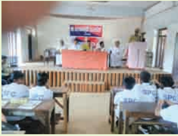
ജനമൈത്രി പോലീസ് ആകാർ