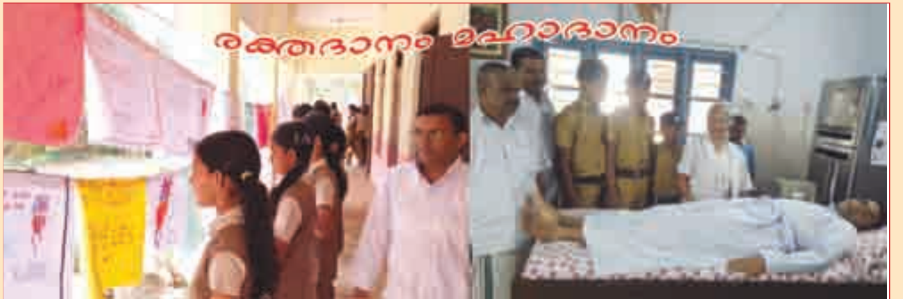
ജൂൺ 14 - രക്തദാനദിനം. രക്തം കൊടുത്തും രക്തം കൊടുക്കുന്നതിന്റെ ആവശ്യകത പ്രചരിപ്പിച്ചും ആചരിച്ചു.