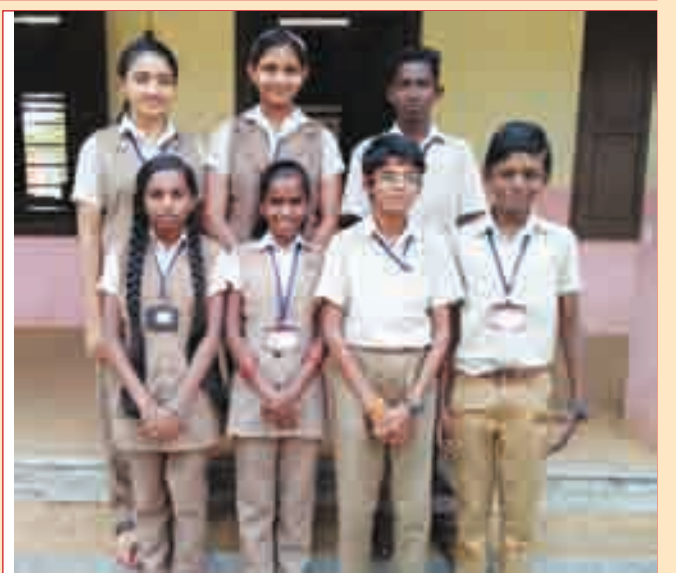
മത്സര വിജയികൾ - വർക്ക് എക്സ്പീരിയൻസിന് ജില്ലയിൽ മത്സരിച്ചവർ