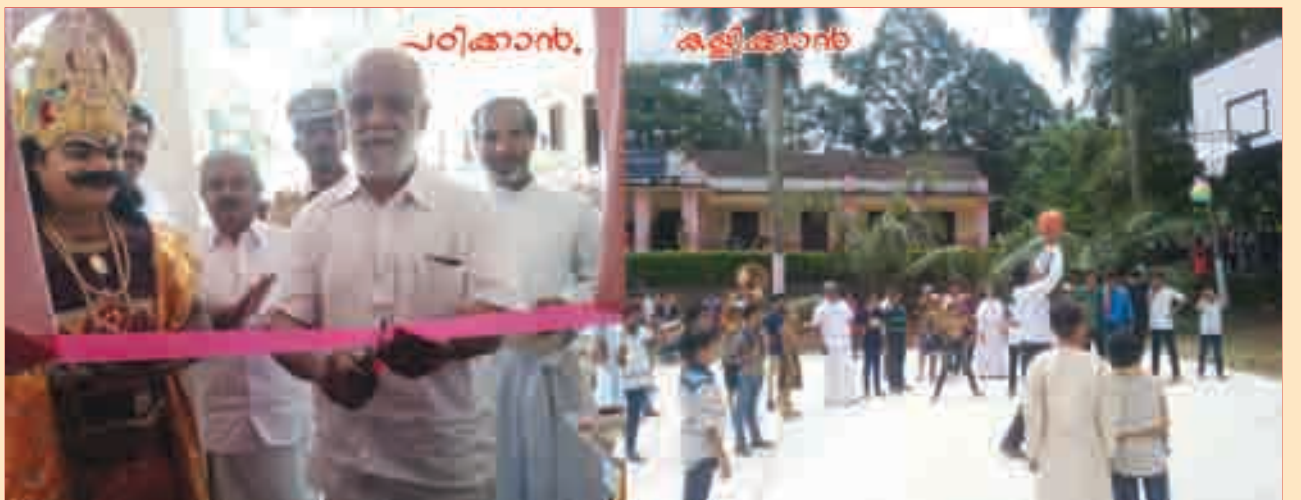
നവീകരിച്ച കമ്പ്യൂട്ടർ ലാബിന്റെയും ബാസ്ക്കറ്റ്ബോൾ കോർട്ടിന്റെയും ഉദ്ഘാടനം