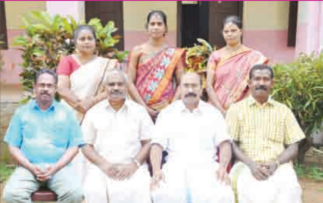
പി.റ്റി.എ. എക്സിക്യൂട്ടീവിലെ മാതാപിതാക്കന്മാരുടെ പ്രതിനിധികൾ.