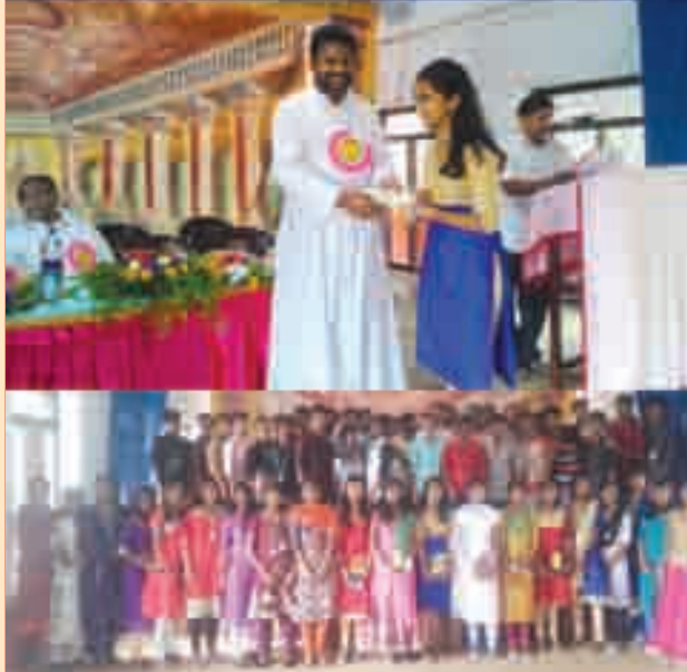
2016 മാർച്ച് എസ്.എസ്.എൽ.സി. പരീക്ഷയിൽ 100% വിജയം കൊണ്ടുവന്നവരെ ആദരിച്ചപ്പോൾ....