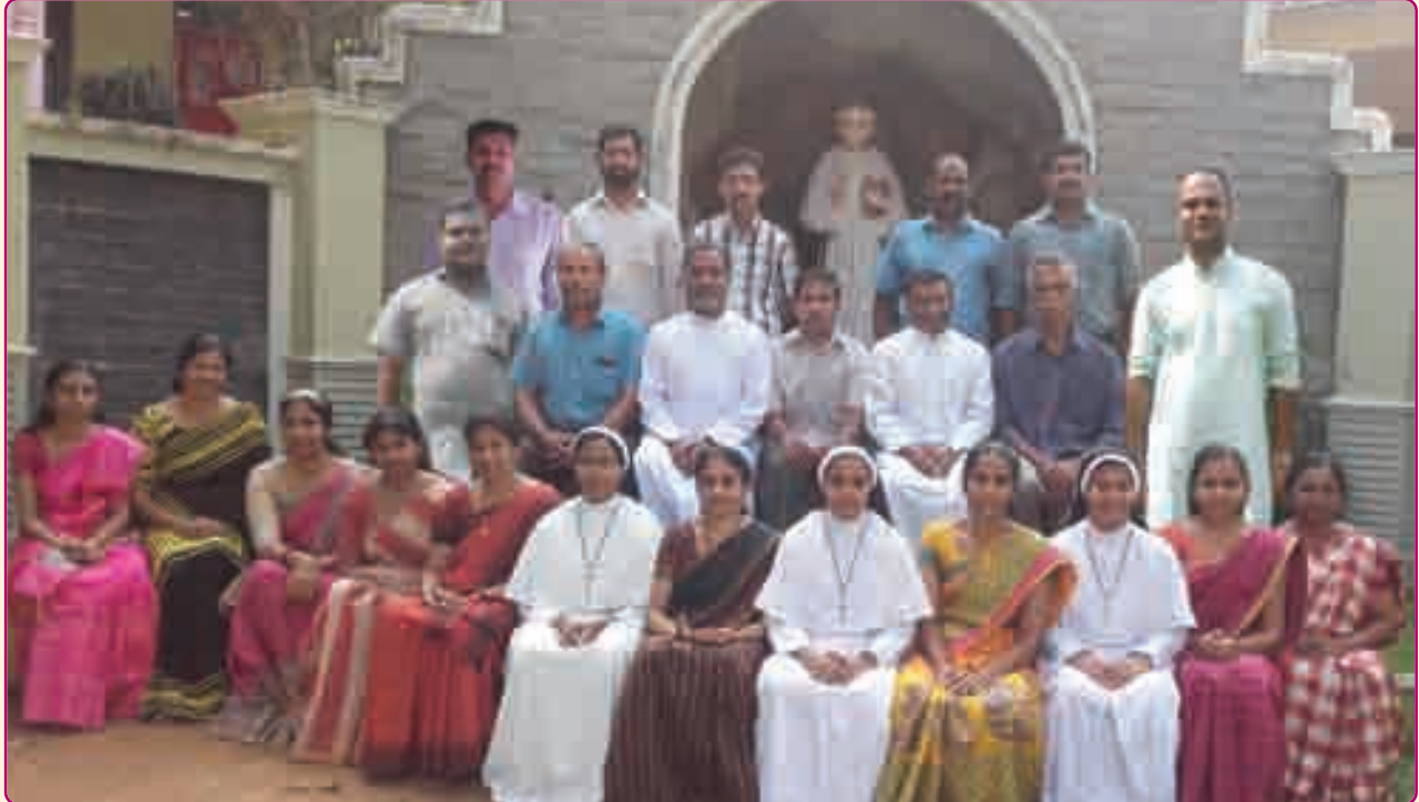
K.T.J.M. ലെ അദ്ധ്യാപകകുടുംബം