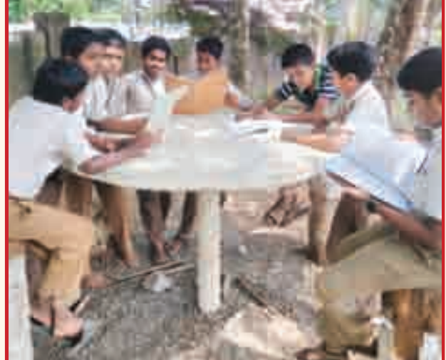
പഠനം ആസ്വാദ്യകരം പ്രകൃതിയുടെ സ്വച്ഛതയിൽ