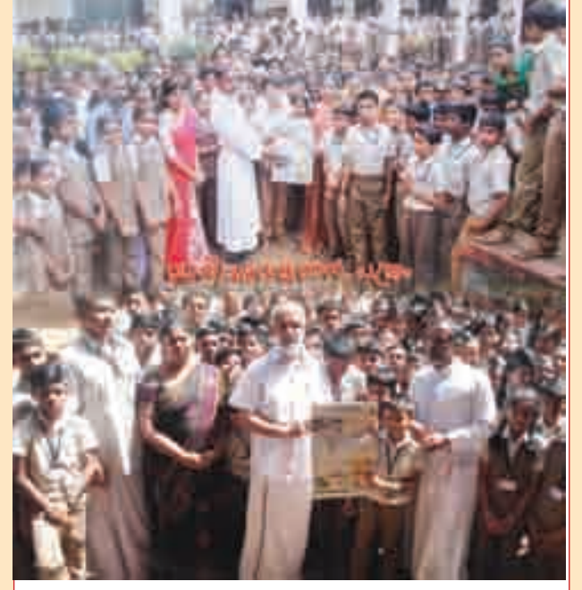
ദീപിക, മനോരമ, മാതൃഭൂമി, ദേശാഭിമാനി, കേരളകൗമുദി എന്നീ പത്രങ്ങൾ മുടക്കുകൂടാതെ സ്കൂളിൽ എത്തുന്നു.