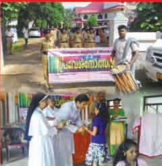
ജൂൺ ഒന്ന്. വിദ്യാരംഭം പ്രവേശനോത്സവമായി ആചരിച്ചു. ഇടവക ദൈവാലയകണത്തിൽനിന്നും പ്രാർത്ഥനയോടെ ആരംഭിച്ച ജാഥ ചെണ്ടമേളത്തിന്റെ അകമ്പടിയോടെ സ്കൂൾ മൈതാനത്തേയ്ക്ക്