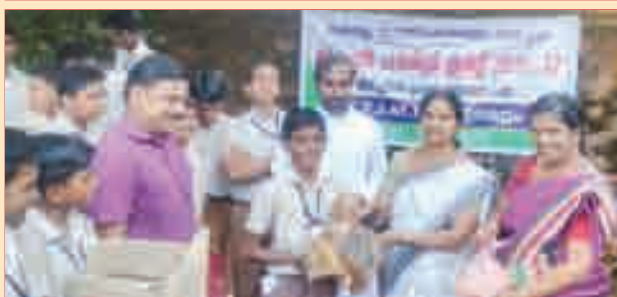
കോഴിവളർത്തൽ, ആഹ്ലാദവും ആദായകരവും. ബാക്ക് യാർഡ് പൗൾട്രി ഫാമിന്റെ ഭാഗമായി കോഴി കുഞ്ഞുങ്ങളെ കുട്ടികൾക്ക് വിതരണം ചെയ്തപ്പോൾ