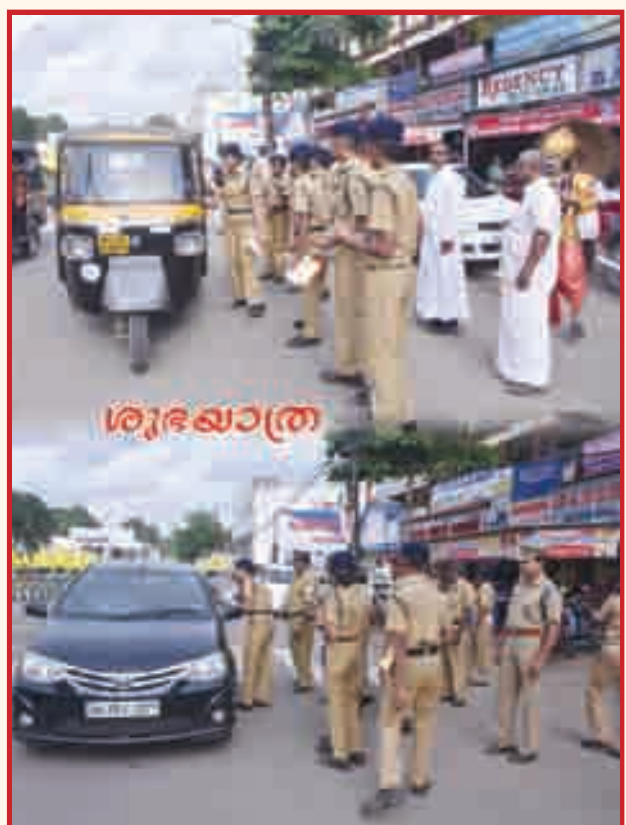
എസ്.പി.സി. സ്റ്റുഡന്റ്സ് യാത്രക്കാർക്ക് ശുഭയാത്ര ആശംസിക്കുന്നു.