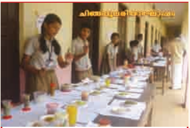
കാർഷികദിനമായ ചിങ്ങം 1 ന് 60 കൂട്ടം പച്ചക്കറിവിഭവങ്ങൾ പ്രദർശിപ്പിച്ചപ്പോൾ