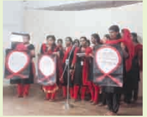
എയിഡ്സിനെതിരെ ബോധവൽക്കരണവുമായി ഐ.എച്ച്.എം.ഹോസ്പിറ്റലിലെ നേഴ്സിംഗ് സ്റ്റുഡൻ്റ്സ് സ്കൂളിലെത്തിയപ്പോൾ