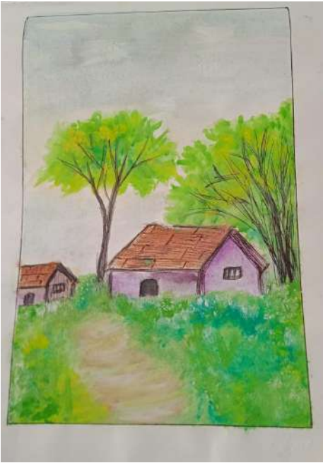
ഹന എം 9 G