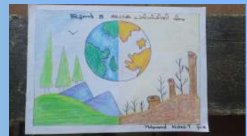
മുഹമ്മദ് മിസ്ഹബ് ടി