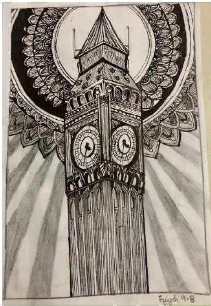
ഫാസി യാഹ് 9 B