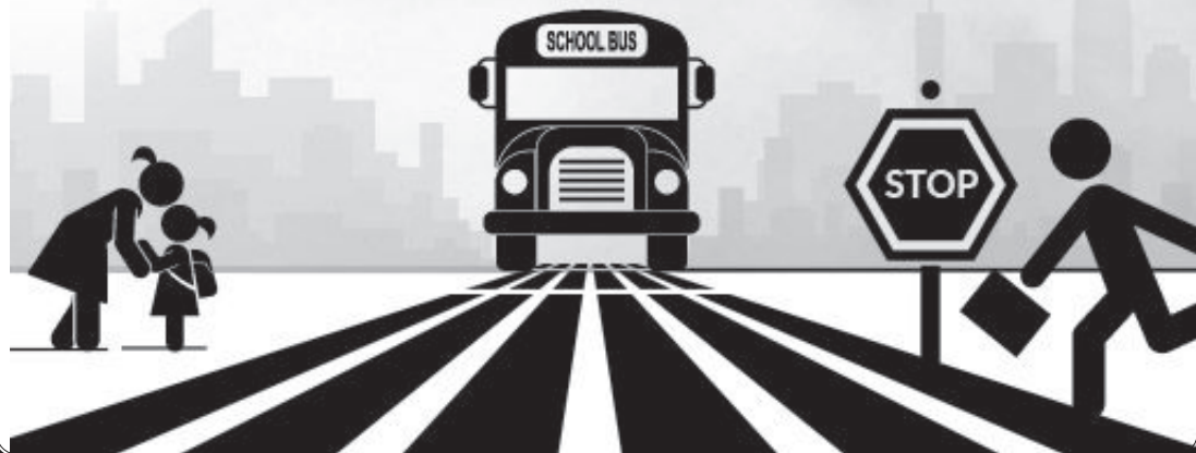
ജീവിതത്തെ സ്നേഹിക്കുന്നവർക്ക് സമയം വെറുതെ കളയാനാവില്ല. - (ഫ്രാങ്ക്ലിൻ)