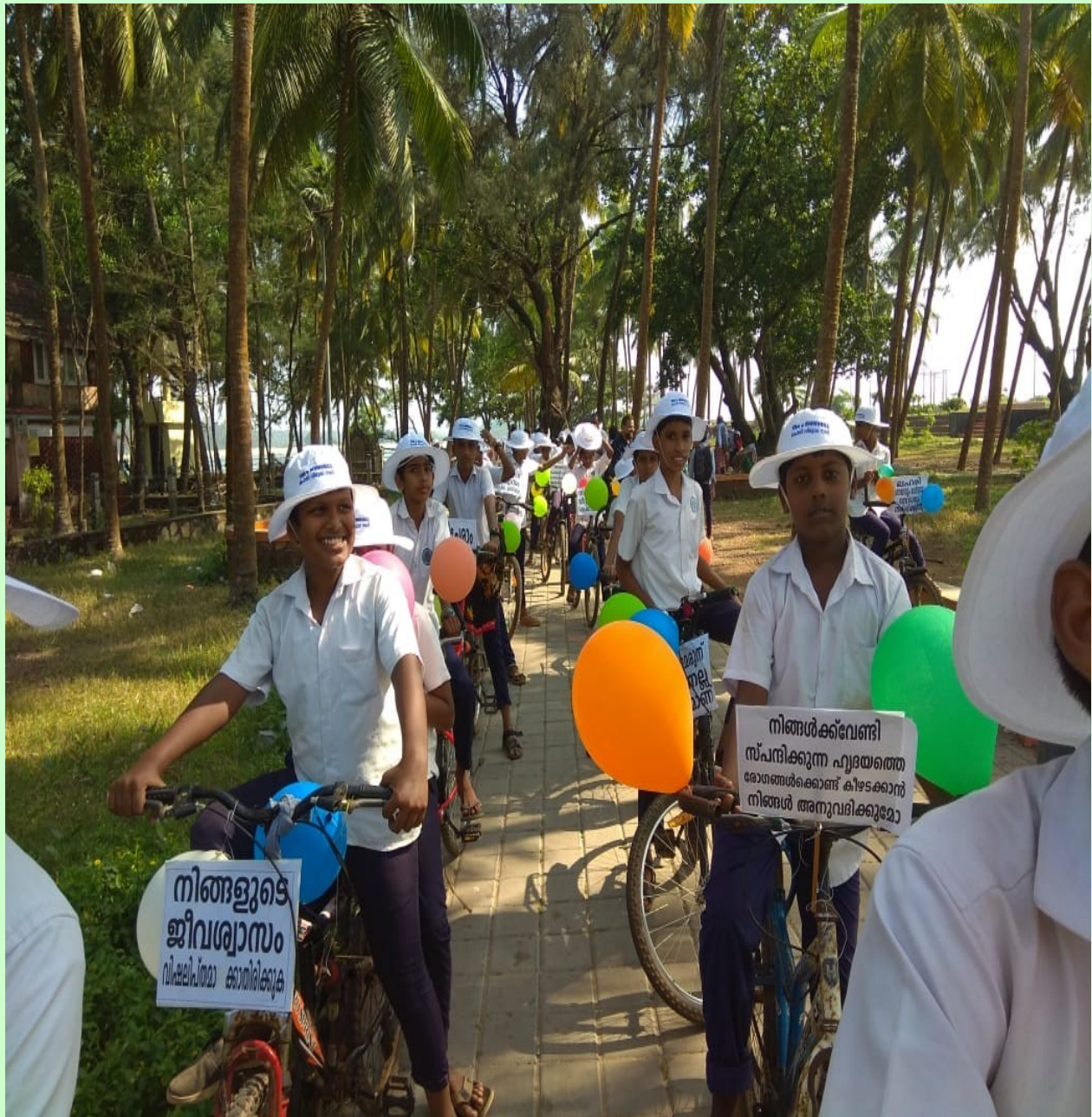
• LITTILE KITES MUM VHSS