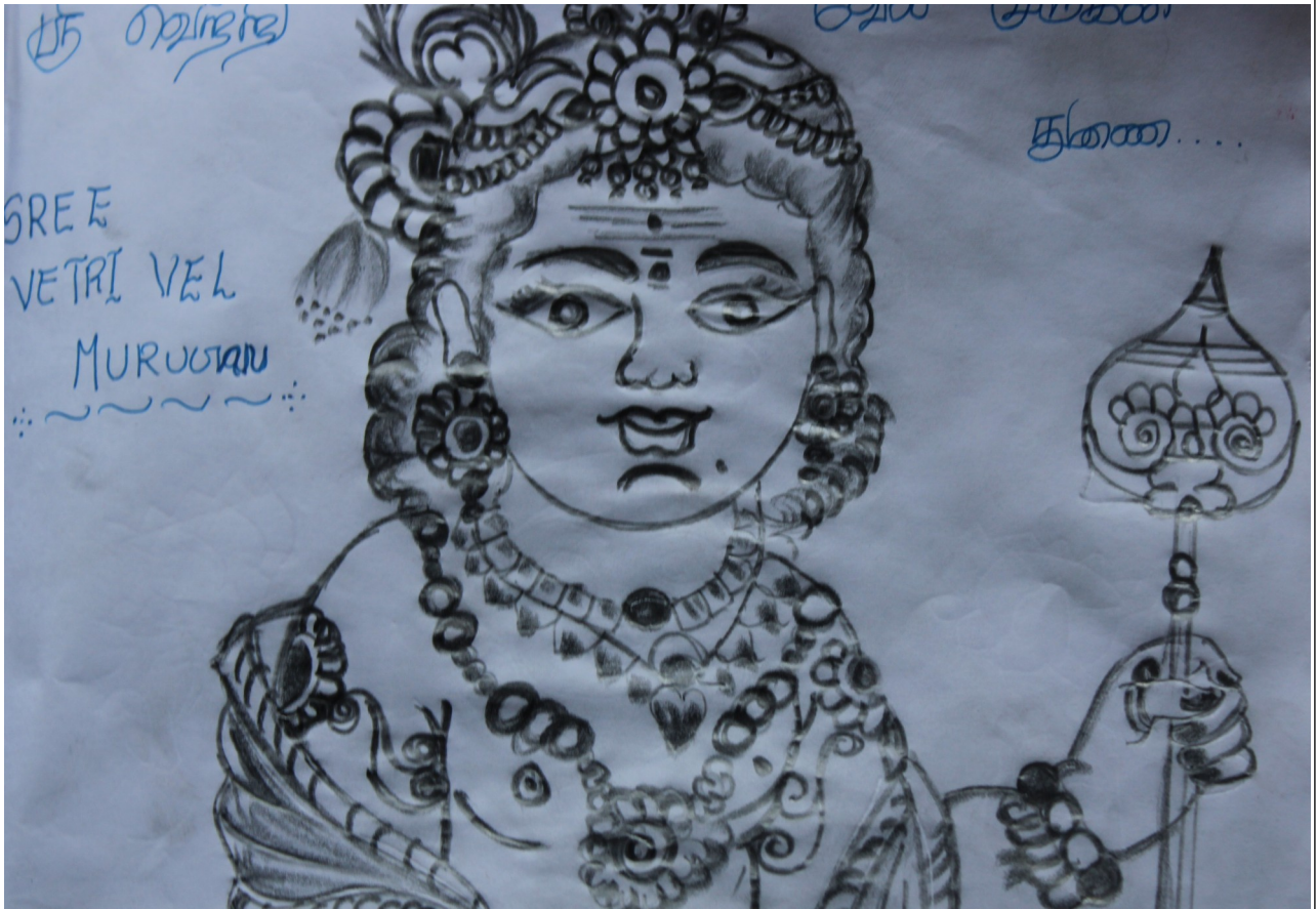
-ഗുരു സ്വാമി- 9 A