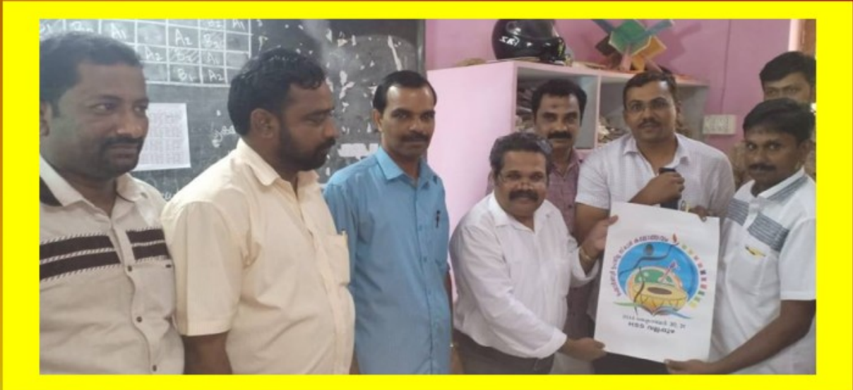
ഔദ്യോഗിക സബ് ജില്ലാ കലോത്സവ ലോഗോ പ്രകാശനം