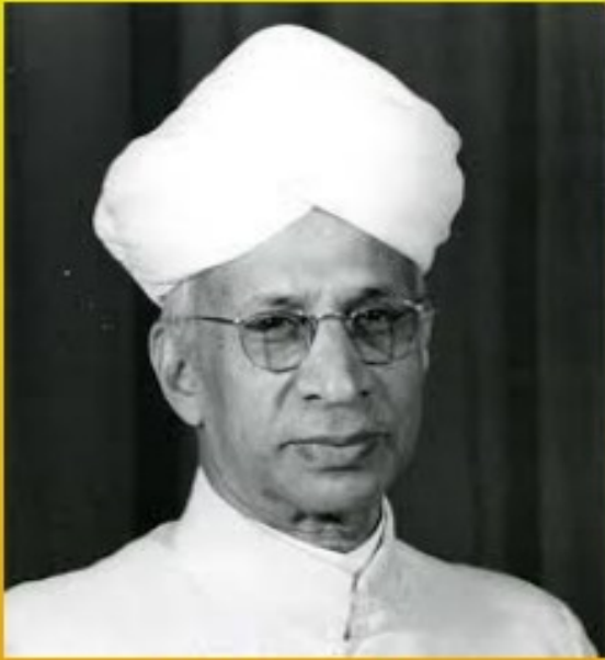
Dr. Sarvepalli Radhakrishnan

Teachers day is celebrated on September 5 . it is the birthday of Dr.s.Radhakrishnan, the second president of India . He was very talented teacher who loved his students . He had a very rare taste for teaching