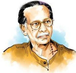
നാട്ടുതനിമകൊണ്ട് മലയാളനാടകവേദിയുടെ രംഗപടം മാറ്റിയെഴുതിയ നാട-