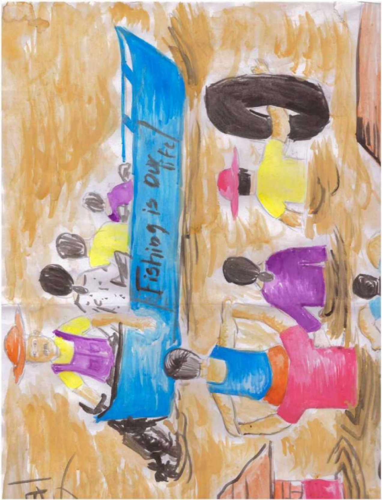
Mishal PC 8B