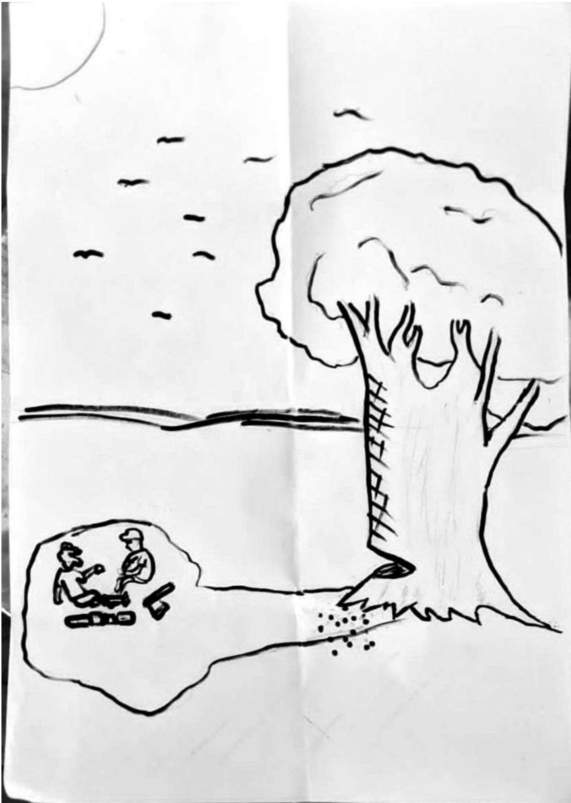
Muhammed Alham AK 9B