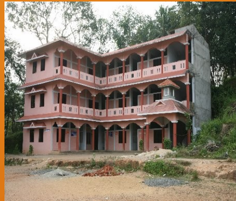
Prasanthi Public School