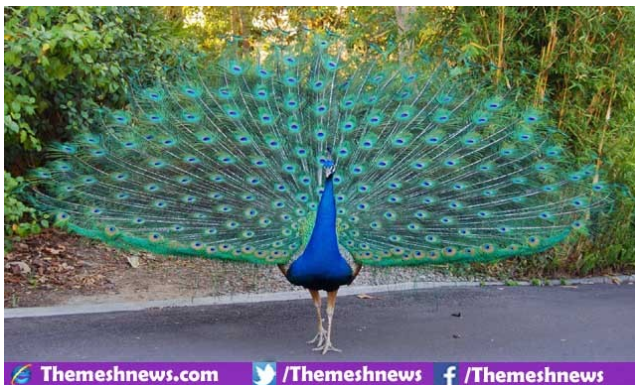
Themeshnews.com /Themeshnews f/Themeshnews

मेढक जल में शोर मचाते, मोर जगत को नाच दिखाते, पपीहे ने भी प्यास बुझाई वर्षा आई, वर्षा आई