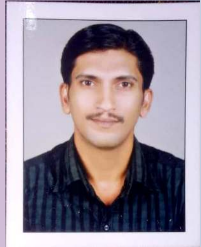
ഫൈസൽ ടി കൈറ്റ് മാസ്റ്റർ

ലിറ്റിൽകൈറ്റ്സിന്റെ ആഭിമുഖ്യത്തിൽ തയ്യാറാക്കിയ "വിസ്തൃയം" എന്ന ഡിജിറ്റൽ മാഗസിന് തങ്ങളുടെ സൃഷ്ടികൾ സമർപ്പിച്ച കുട്ടികൾക്കും ഈ മാഗസിന് പിന്നിൽ പ്രവർത്തിച്ച വിവര സങ്കേതിക വിദ്യയിൽ മികവ് പുലർത്തിയ ലിറ്റിൽകൈറ്റ്സ് അംഗങ്ങൾക്കും എല്ലാവിധ ഭാവുകങ്ങളും നേരുന്നു.